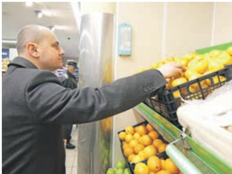
Качество и цены товаров в магазинах активисты «Народного контроля» проверяют дважды в месяц

В конце июня единороссы сравнили цены на продукты в сетевых и магазинах шаговой доступности Северного Измайлова. В ходе предыдущего рейда активисты обратили внимание на завышенную стоимость сахара в магазине «Вавил»: 120 рублей за килограмм против 54 рублей за кило (средняя цена по торговым сетям). Партийцы поставили вопрос на контроль. В итоге, как рассказал член местного политсо-