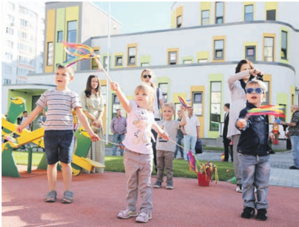
В рамках партийного проекта «Детские сады — детям» до конца следующего года в столице появится еще пять десятков детских садов, в которые будут ходить более 11 тысяч малышей