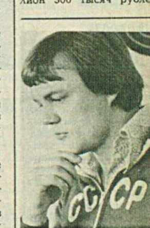
НА СНИМКЕ: первый чемпион Олимпиады-80 — Александр МЕЛЕНТЬЕВ.

В эти дни металлурги на ударной вахте в честь предстоящего съезда партии приняли повышенные обязательства. Решено дать стране сверх плана года 1200 тонн стали, 2200 тонн проката, а всего реализовать продукцию на миллион 300 тысяч рублей.