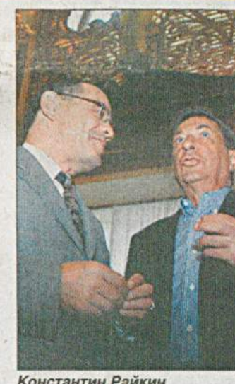
Константин Райкин и Игорь Кваша