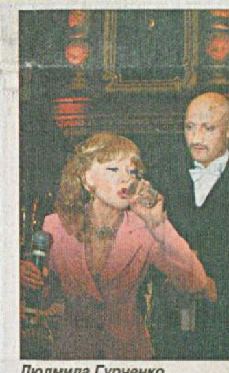
Людмила Гурченко и Гоша Куденко