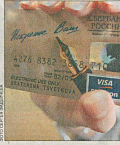
даже продолжает начислять проценты, предусмотренные договором с банком. Кроме того, карточкой по-прежнему можно расплачиваться в магазине или снимать с нее деньги в любом отделении Сбербанка через оператора.

вышенным интересом к банкоматам со стороны владельцев пластиковых карт — количество операций, связанных со снятием наличных денег, резко возросло. В результате система не выдержала и дала сбой. Как ожидается, банкоматы станут доступны сегодня или, в крайнем случае, завтра. Банкиры успокаивают: все счета останутся в целости и сохранности.