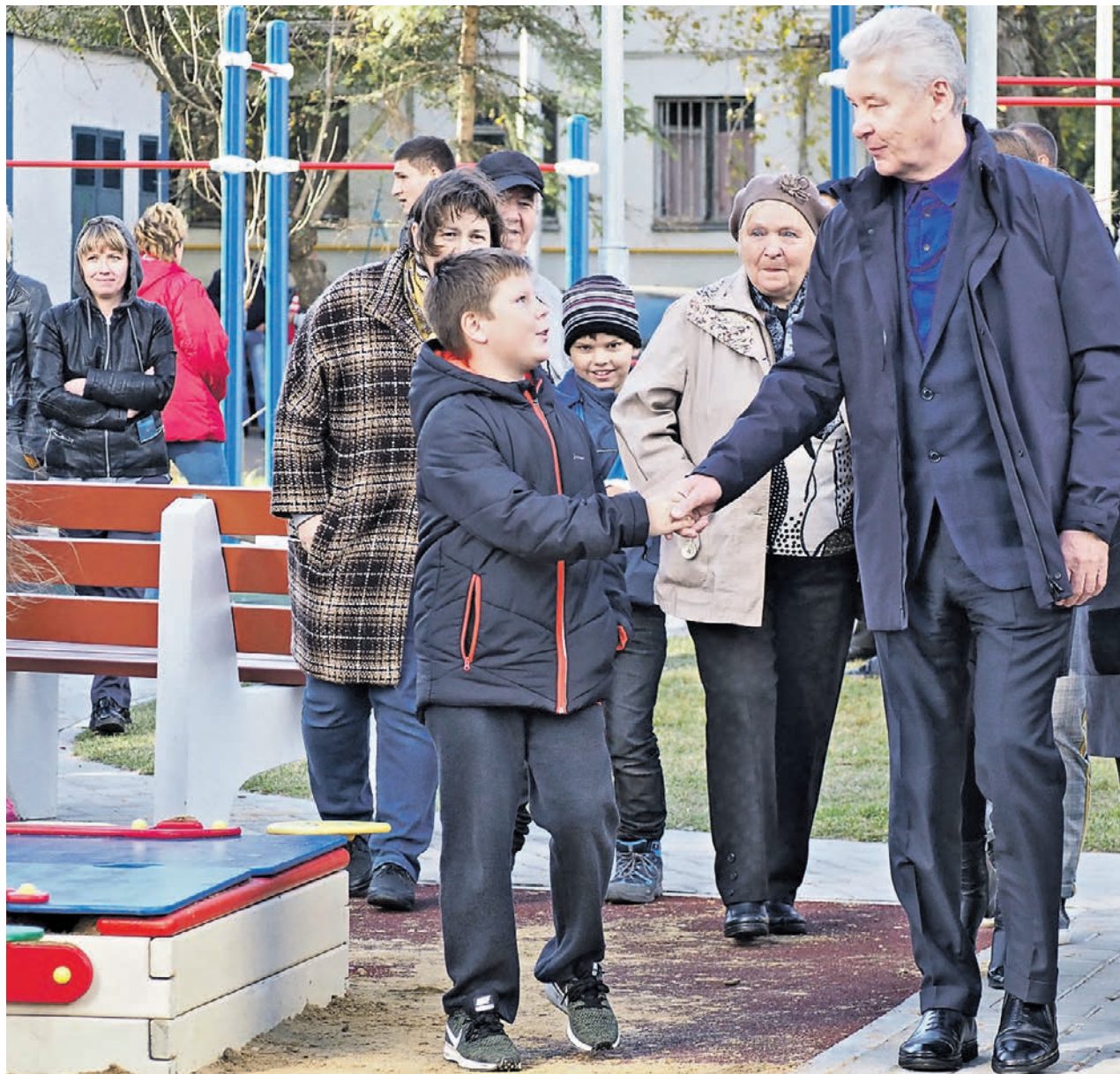
Политика мэра Москвы Сергея Собянина находит отклик у жителей всех возрастов

новых решений будут регулярно информировать районные и окружные газеты, другие городские издания. В разрезе каждого района и поселения программа «Мой район» содержит план действий по трем основным направлениям: качество, комфорт и уникальность.