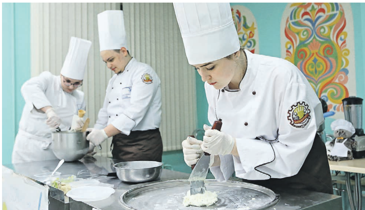
Самое вкусное мороженое готовят из сливок, сахарной пудры и замораживают с помощью жидкого азота