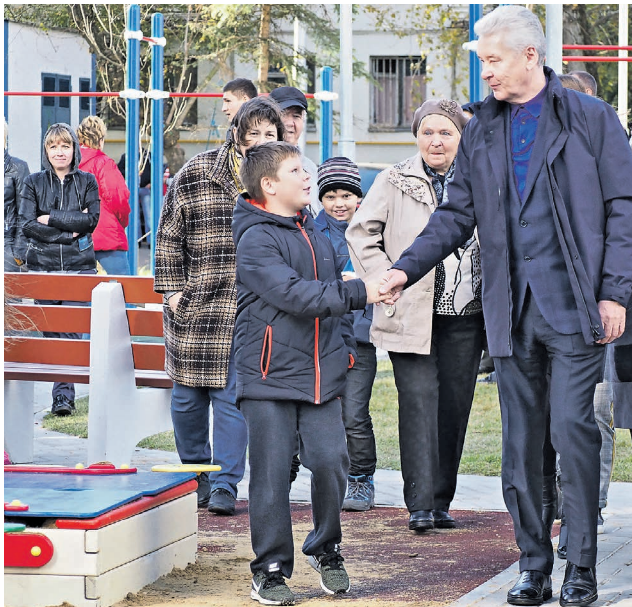
Политика мэра Москвы Сергея Собянина находит отклик у жителей всех возрастов

В ближайшие дни программа «Мой район» будет опубликована на портале MOS.RU. О ее содержании и реализации, выработке