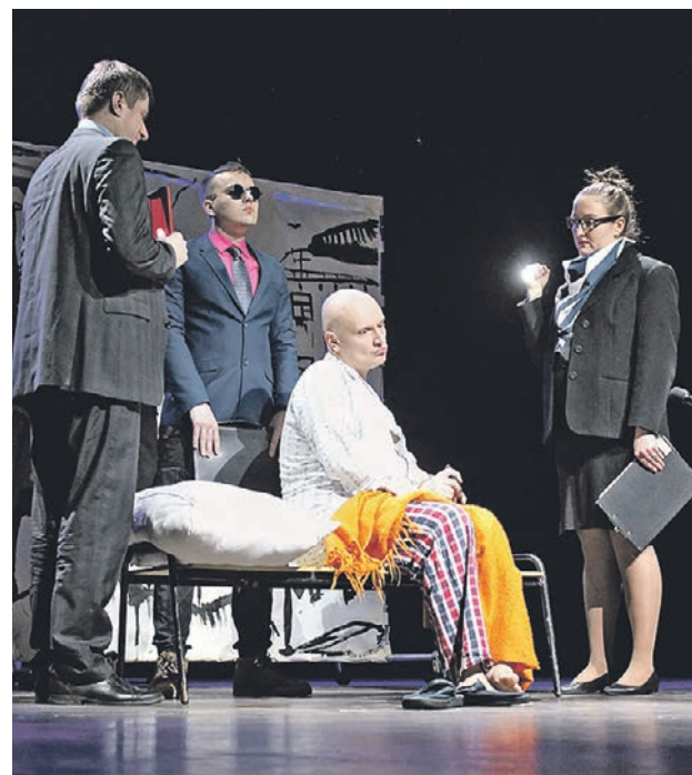
Артисты «Студии ДТП» выступили в Культурном центре «Москворечье» с постановкой «Десять юморят»