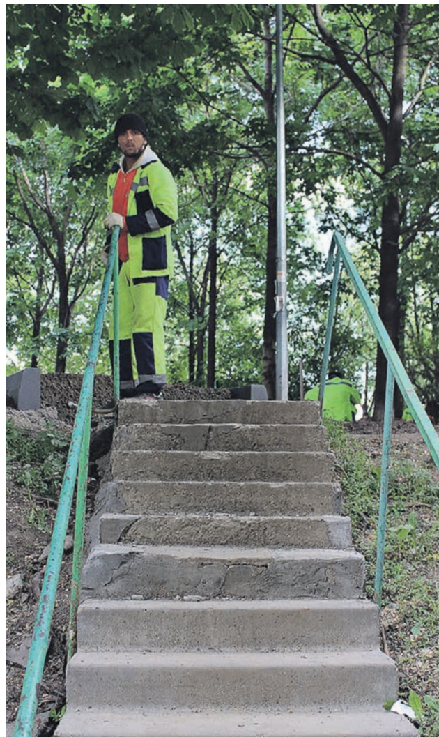
Для безопасности жителей ступеньки и перила на крутом спуске восстановили

Жители 5-го квартала Капотни обратились в редакцию газеты с жалобой на плохое состояние лестницы, ведущей от дома № 20 к автобусной остановке.