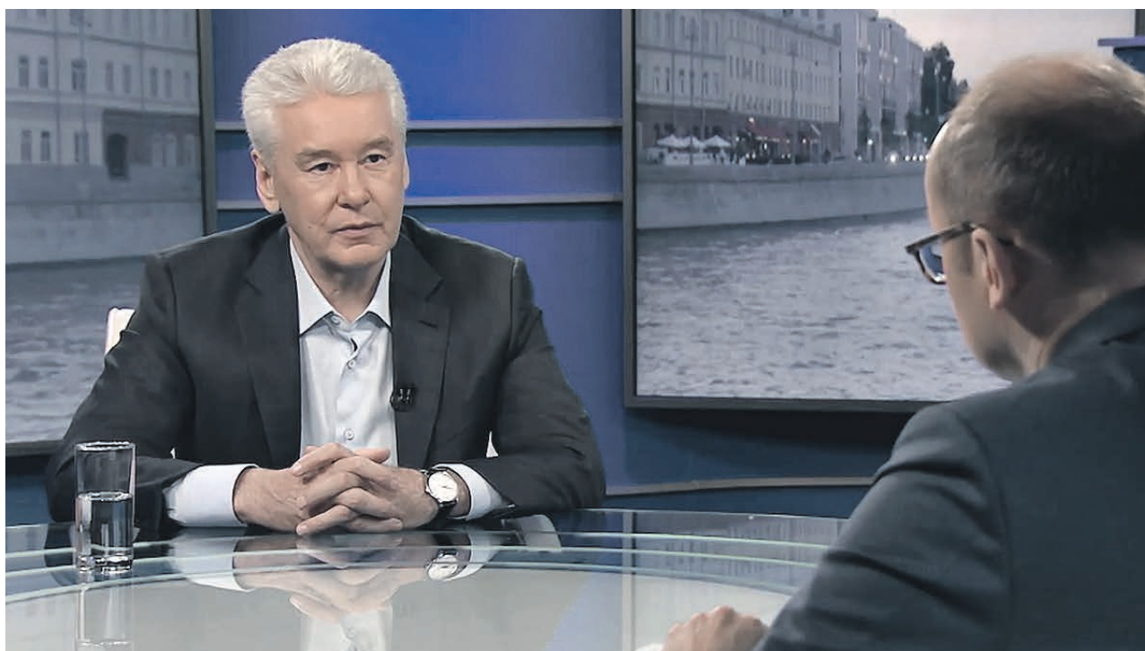
Мэр Москвы Сергей Собянин рассказал об интернет-платформе, посвященной программе

проживания в районе — какие объекты социальной сферы, какие услуги там можно получить, реконструкция каких зданий планируется, где сделают ремонт и какие социальные объекты построят.