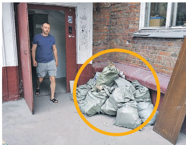
Оставленные мешки со строительным мусором коммунальщики должны убрать