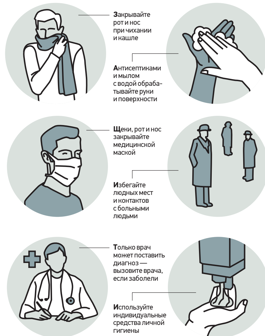
По данным Роспотребнадзора