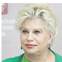
ТАТЬЯНА ПОТЯЕВА УПОЛНОМОЧЕННЫЙ ПО ПРАВАМ ЧЕЛОВЕКА В ГОРОДЕ МОСКВЕ

На втором месте были вопросы социального обеспечения. В первую очередь речь шла о выплатах — перерасчета пенсий, принятых на федеральном уровне мер поддержки семей с детьми. Поступало очень много обращений от людей пожилого возраста. В основном по поводу мошеннических действий. Люди сталкивались с предложениями купить по завышенным ценам лекарства, пищевые добавки, якобы помогающие сохранить здоровье, заменить счетчики воды и электричества по ценам вдвое выше государственных. Жалобы поступали и по поводу махинаций с пластиковыми картами. Мы в таких случаях немедленно связываемся с правоохранительными органами, просим оказать поддержку. Для того чтобы улучшить понимание проблемы населения, мы провели масштабный правовой онлайн-марафон для пенсионеров — рассказали им о методах мошенников, активизировавшихся в этот период, и способах уберечься от возможных потерь. Нередко звучали вопросы по здравоохранению — свыше 230 обращений. Люди интересовались, где и как сдать анализы, рассказывали о качестве медицинских услуг. За время пандемии я 13 раз посетила следственные изоляторы столицы в связи с обращениями граждан. Должна сказать, что в них были созданы все условия для того, чтобы максимально обезопасить от коронавируса людей, которые сегодня не могут сами себя защитить, например, там постоянно проводится санитарная обработка.