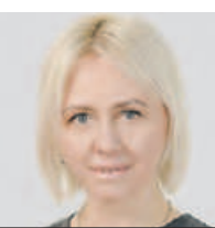
ЕКАТЕРИНА ДРАГУНОВА ПРЕДСЕДАТЕЛЬ КОМИТЕТА ОБЩЕСТВЕННЫХ СВЯЗЕЙ И МОЛОДЕЖНОЙ ПОЛИТИКИ МОСКВЫ

Отмечу, что перед началом работы кандидаты обязательно пройдут обучение в дистанционном и очном форматах. Всех помощников колл-центра обеспечат питанием и средствами индивидуальной защиты. И мы по-прежнему набираем волонтеров и для выполнения заявок — доставки продуктов, лекарств и товаров первой необходимости.