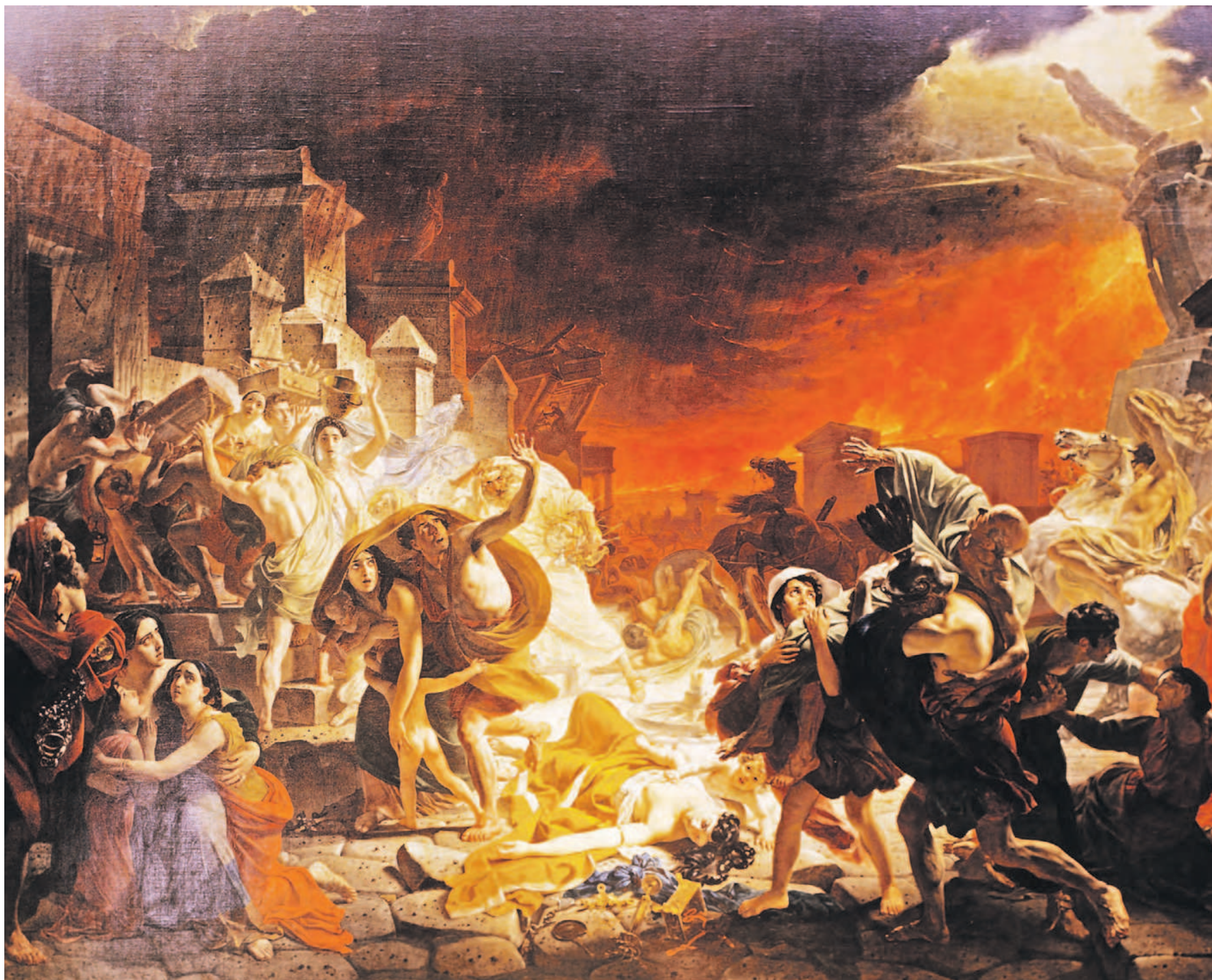
«Последний день Помпеи». Холст, масло, 1833 год. Художник Карл Брюллов (1799–1852). Репродукция из Государственного Русского музея, находящегося в Санкт-Петербурге

Какие факторы могут стать причиной падения нашей цивилизации