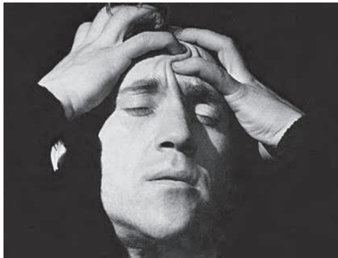
29 ноября 1971 года. Владимир Высоцкий в спектакле по трагедии Уильяма Шекспира «Гамлет»

Творчество Высоцкого давно разобрано на цитаты, которые точно знают даже люди, которые, возможно, никогда не слышали ни одной песни Высоцкого. Но много ли найдется таких, как и тех, кто никогда не слышал о Пушкине, Маяковском, Толстом? Владимир Высоцкий давно стал явлением русской культуры безо всяких кавычек и допущений. Сегодня его проходят в школах, когда говорят об эпохе застоя. Стартовавший во время оттепели, Высоцкий в своих песнях тонко чувствовал пульс времени, словно ощущал свое предназначение стать поэтом целой эпохи. — Он мог до утра сидеть с гитарой, что-то подбирать, записывать строки, приходив-