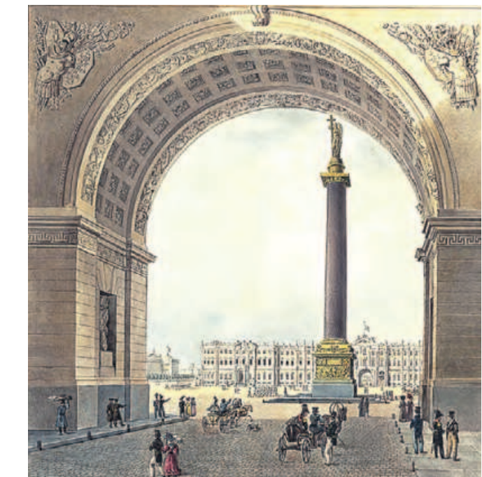
Картина «Вид на Дворцовую площадь через арку Главного штаба» кисти Карла Беггрова (1829)

«Вечерняя Москва» продолжает вспоминать события, которые происходили в этот день и повлияли на ход истории.