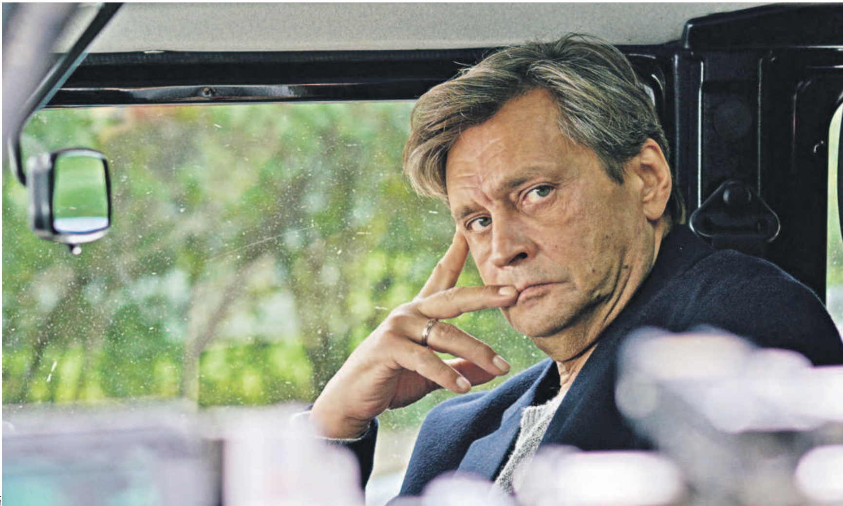
2022 год. Александр Домогаров в роли судьи Нестерова в сериале «Капкан на судью» Ярослава Мочалова. Его герою придется оплатить профессиональную ошибку, подтверждая истину — «ничто на земле не проходит бесследно...»

Второй за полгода сериал, так или иначе осененный судебской мантией — это любопытно: уж не тренд ли? Ведь до этого судьи нечасто становились у нас героями многосерийных лент. Впрочем, «Ваша честь» с Олегом Меньшиковым в главной роли и «Капкан на судью», где роль судьи сыграл Александр Домогаров, — картины разные и о разном. Объединяет их, пожалуй, одно: постулат о том, что судья — тоже человек, а не кладнокривно функционирующая машина правосудия, и, как у каждого человека, у него есть свои скелеты в шкафу и мотивы для поступков разного уровня нравственности. Ну и еще — забавное совпадение — события в обоих случаях разворачиваются в небольших приморских городках. Ох уж эти курорты! ...Ничто, казалось бы, не угрожало судье Романову из сериала «Ваша честь» до тех пор, пока его сын не сбил сына криминального авторитета. Потом ради спасения дел «ваша честь» повернул того, что подумает страшно. Вот и уважаемый судья Нестеров из нового проекта известен всем как неподкупный меч закона, к тому же прославившийся особым чутьем на настоящих преступников. Тщательное