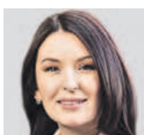
ГУЗЕЛИЯ ИМАЕВА ГЕНЕРАЛЬНЫЙ ДИРЕКТОР НАЦИОНАЛЬНОГО АГЕНТСТВА ФИНАНСОВЫХ ИССЛЕДОВАНИЙ

Спонтанные покупки идут на пользу бизнесу. Все же для предпринимателей это дополнительный доход. Но не стоит забывать, что качество оказания услуг и предоставляемых товаров не должно ухудшаться. Спонтанные покупки в 90 процентах случаев совершаются по завышенным ценам и на эмоциях. Зачастую люди сначала покупают, а только потом задумываются над их необходимостью. Но предприниматель должен пользоваться этой возможностью получения дополнительных средств осторожно. Необходимо стремиться к лояльности покупателей, доверие которых нельзя терять. Тогда люди будут возвращаться снова и снова.