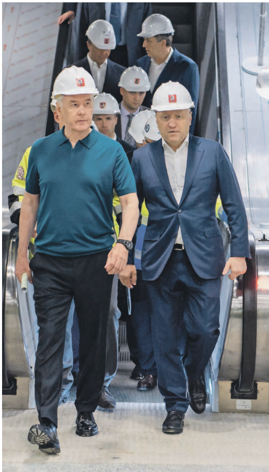
Вчера 13:35 Мэр Москвы Сергей Собянин (слева) и заместитель мэра столицы по вопросам градостроительной политики и строительства Андрей Бочкарев осматривают ход работ на станции «Сокольники» Большой кольцевой линии метро. В этом году станцию в составе северо-восточного участка линии откроют для пассажиров