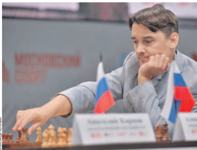
Вчера 16:12 Гроссмейстер Александр Морозевич обдумывает ход в партии против легендарного Анатолия Карпова

Вчера Московский городской суд огласил приговор членом организованной преступной группы (ОПГ) «Шараповское».