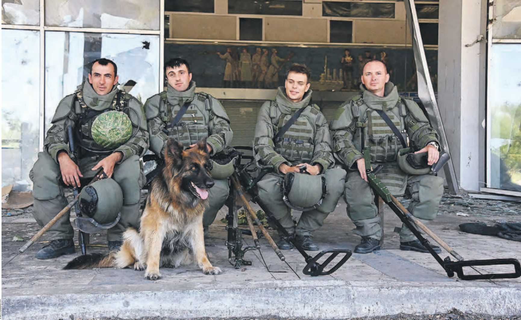
20 июля 10:24 Специалисты Международного противоминного центра ВС России начали разминирование аэропорта Мариуполя. Им предстоит обследовать 239 гектаров территории. Уже в начале работ обнаружено большое количество осколков и боеприпасов. Их уничтожают на месте