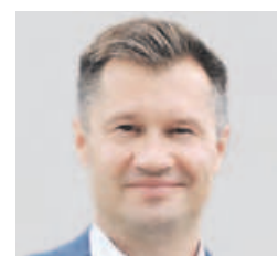
АЛЕКСЕЙ НЕМОВ РОССИЙСКИЙ ГИМНАСТ, ЧЕТЫРЕХКРАТНЫЙ ОЛИМПИЙСКИЙ ЧЕМПИОН, ПЯТИКРАТНЫЙ ЧЕМПИОН МИРА