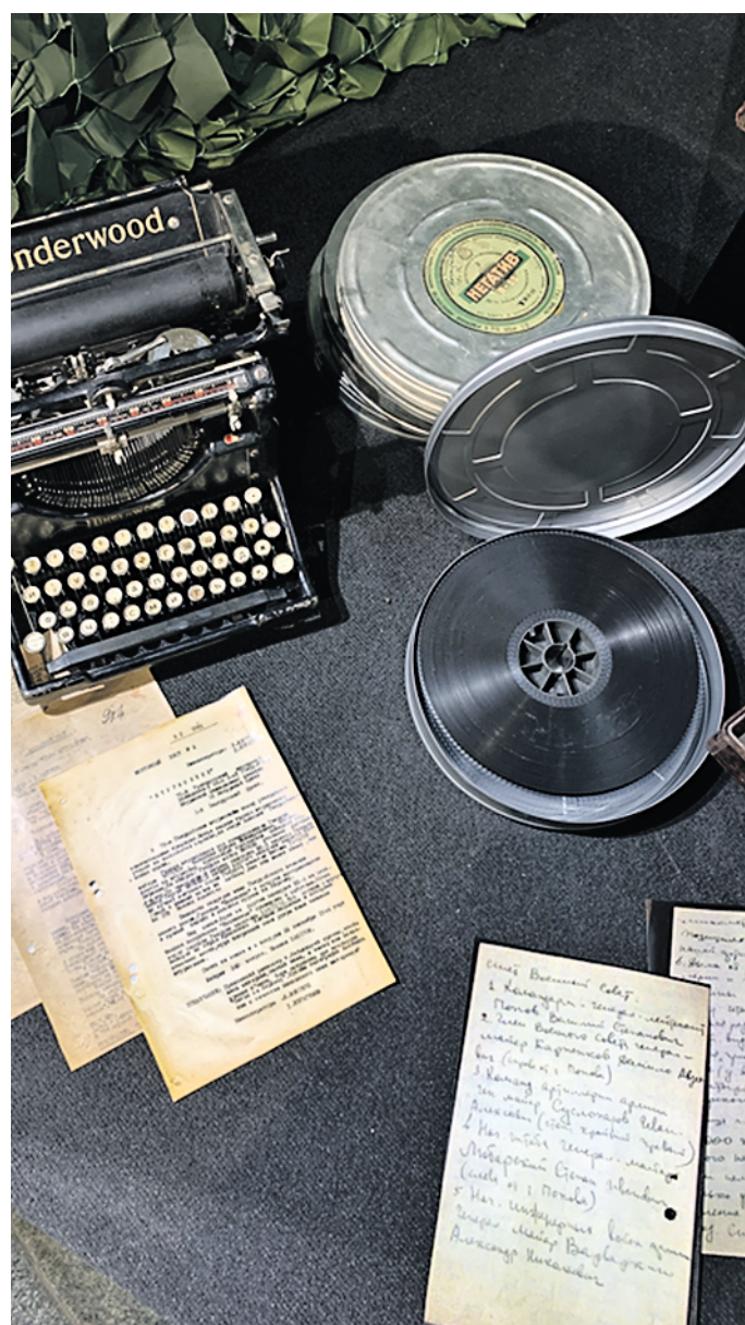
Экспонаты выставки «Подвиг народа в объективе кинокамеры»: пишущая машинка Underwood и пленка, на которую снимали хронику

Музей Победы 12 октября заканчивает работу временная выставка «Подвиг народа в объективе кинокамеры», посвященная военным корреспондентам. Эти люди ценой собственной жизни сделали не только историю. Они запечатлели на века то, что навсегда останется в памяти миллионов людей. Музей Победы — величественное место. Приходя сюда, переполняешься чувством гордости, скорби и невероятной благодарности. Каждый этаж здесь наполнен мелодиями и звуками интерактивных панелей, которые рассказывают посетителям историю о великих подвигах солдат и тружеников тыла. Поднимаюсь на нужный этаж, захожу в большую комнату и погружаюсь в звенящую тишину. Внезапно ее прерывает интерактивная доска, стоящая в углу. Оттуда доносится рассказ о жизни и работе Бориса Исааковича Маневича — кинооператора Северного флота, 2-го Белорусского фронта, фронтовые репортажи которого вошли в ряд знаменитых военных фильмов. Рядом с доской витрина, где представлены личные вещи Маневича: фотоаппарат, листы с заметками, фотографии с театра военных действий... Иду дальше. Перед глазами камера, каска, пишущие машинки Underwood и Rheinita 1930–1940-х годов, полевой телефон, военная гимнастерка с сывяном отличением — на ней висит износившийся чехол для фотоаппарата. Все это принадлежало военному режиссеру Максиму Плюскину. Тишина выставки помогает погрузиться в атмосферу каж-