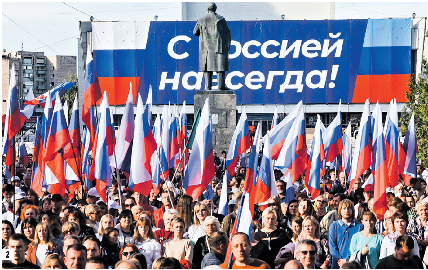
30 сентября. Президент РФ Владимир Путин (в центре), глава Херсонской области Владимир Сальдо, глава Запорожской области Евгений Балицкий, глава Донецкой Народной Республики Денис Пушилин и глава Луганской Народной Республики Леонид Пасечник (слева направо) в Большом Кремлевском дворце на церемонии подписания договоров о вступлении в состав РФ новых регионов (1) Участники праздничного митинга в поддержку подписания соглашения о вхождении ЛНР в состав РФ, который прошел в тот же день на площади Героев ВОВ в Луганске (2)