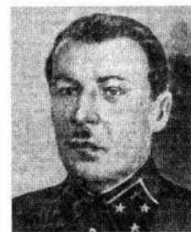
Генерал-лейтенант артиллерии Л. А. Говоров.