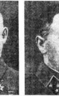
Генерал-лейтенант В. Н. Кузнецов.