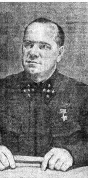
Командующий Западным фронтом генерал армии Г. К. Жуков.