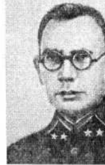
Генерал-майор А. А. Власов.