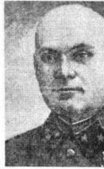
Генерал-майор Д. Д. Лелюшенко.