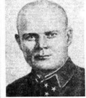
Генерал-лейтенант Ф. Н. Голиков.