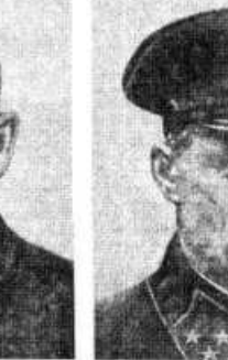
Генерал-лейтенант К. К. Рокоссовский.