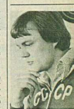
НА СНИМКЕ: первый чемпион Олимпиады-80 — Александр МЕЛЕНТЬЕВ.

В эти дни металлурги на ударной вахте в честь предстоящего съезда партии приняли повышенные обязательства. Решено дать стране сверх плана года 1200 тонн стали, 2200 тонн проката, а всего реализовать продукцию на миллион 300 тысяч рублей.