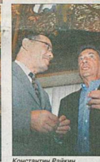
Константин Райкин и Игорь Кваша