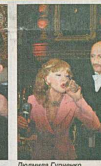
Людмила Гурченко и Гоша Куценко