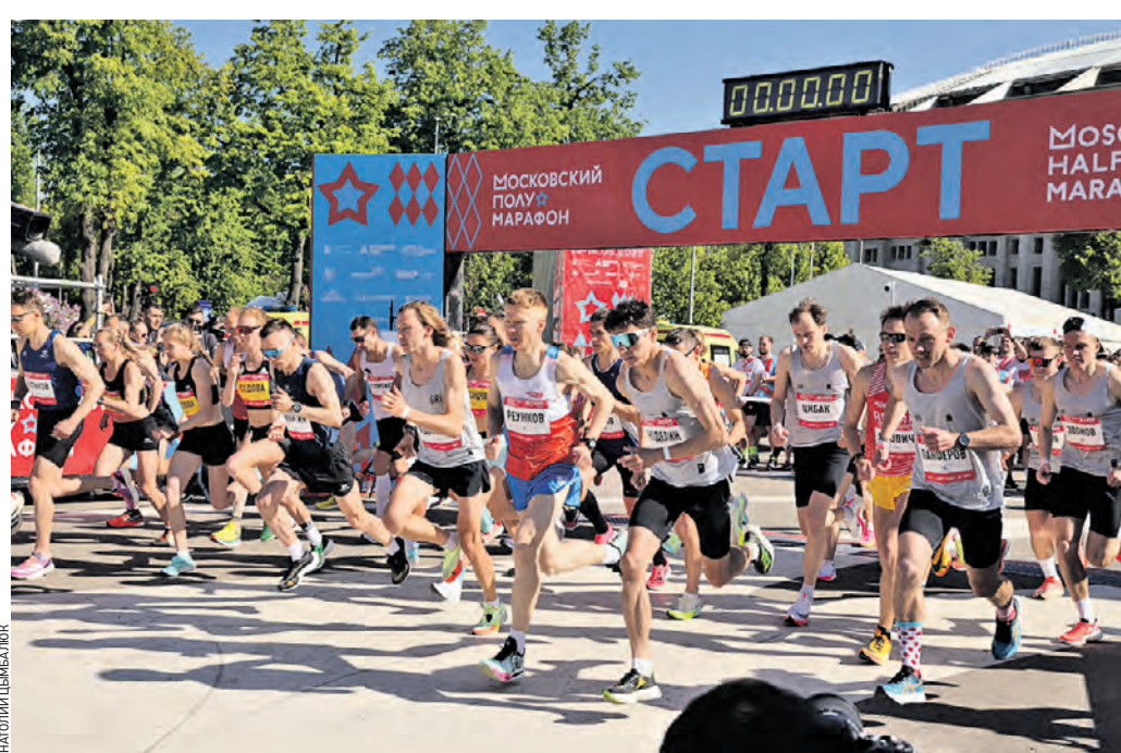
Вчера 09:06 Участники девятого Московского полумарафона стартуют на территории спортивного комплекса «Лужники», чтобы преодолеть дистанцию в 21 километр

Вчера в спорткомплексе «Лужники» прошел полумарафон. Несколько десятков тысяч бегунов со всей России проверили свои силы.