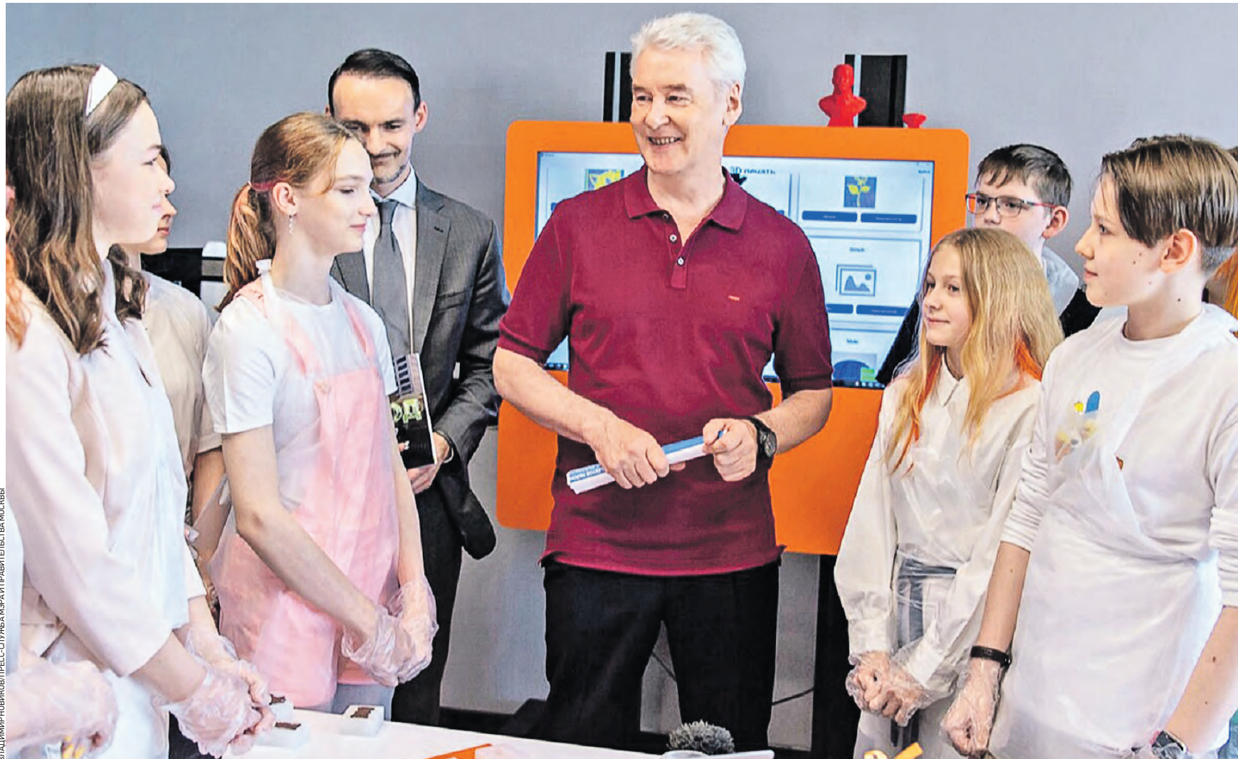
9 июня 2022 года. Мэр Москвы Сергей Собянин (в центре) во время посещения детского технопарка «SupreFood Технологии» на территории Московского государственного университета пищевых производств. В систему образования активно внедряются современные отечественные разработки