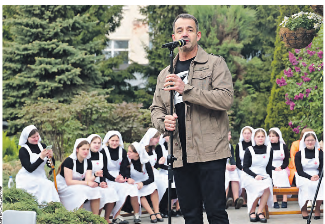
Вчера 11:39 Российский актер Дмитрий Певцов выступает перед студентами медицинских колледжей Москвы на благотворительном фестивале «Белые крылья»

Это большая утрата. Все знали, что он болен, но надеялись на чудо. А его книга «Когда журналисты были свободными» теперь будет учебником для нового поколения.