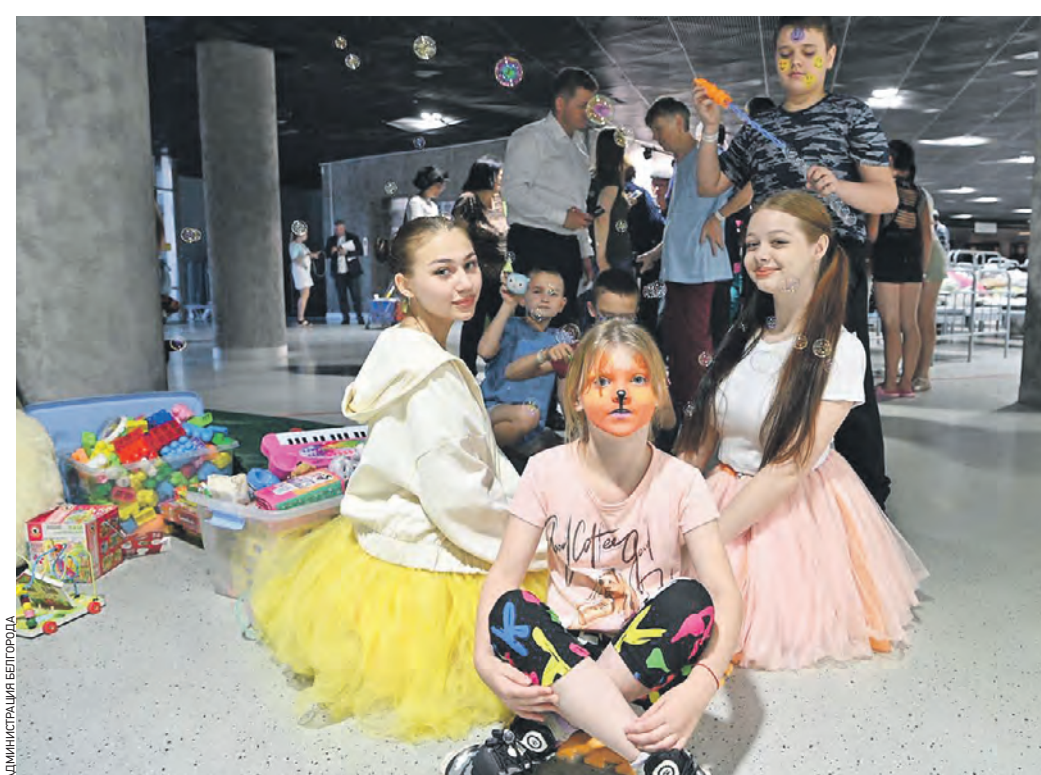
1 июня 2023 года. Волонтеры пункта временного размещения в Белгородской области устроили праздник для детей, эвакуированных из Шебекина