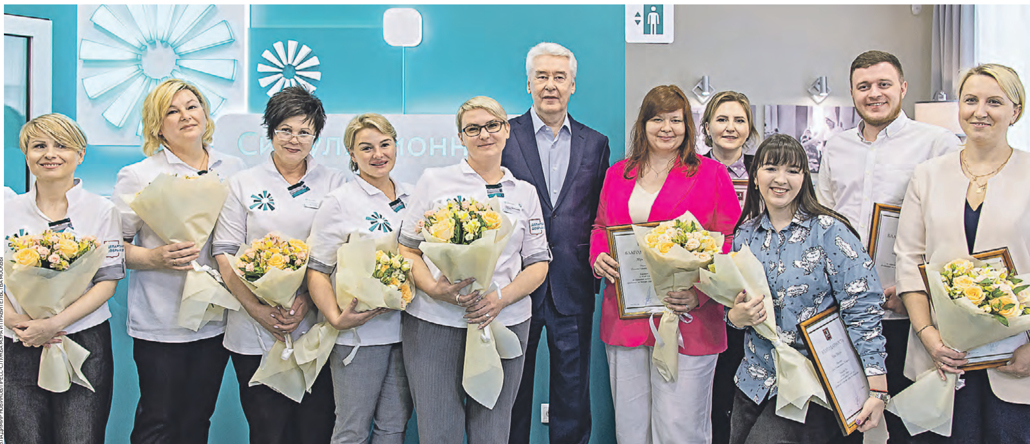
Вчера 13:07 Мэр Москвы Сергей Собянин (в центре) на открытии Симуляционного центра обучения навыкам профессионального ухода поздравил сотрудников социальной сферы с профессиональным праздником, вручил им благодарности и цветы, а также сделал с ними совместное фото на память