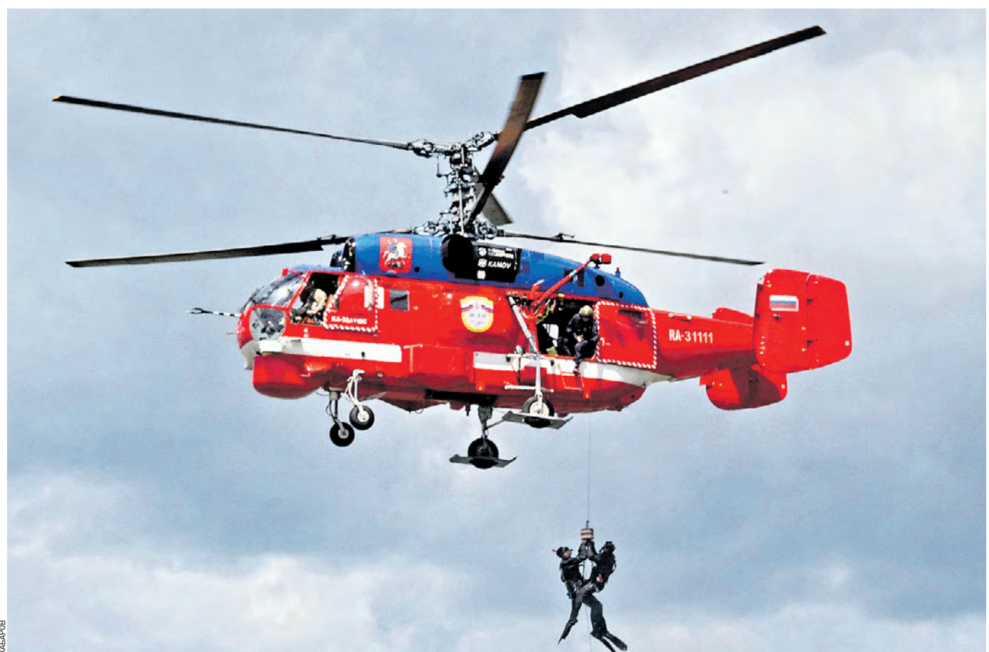
Вчера 15:25 Сотрудники Московского авиационного центра участвуют в показательной тренировке по выполнению аварийно-спасательных работ и пожаротушения в ТиНАО

— Мы производили ликвидацию пожара на заводе «Серп и Молот», природных пожаров в Москве и области