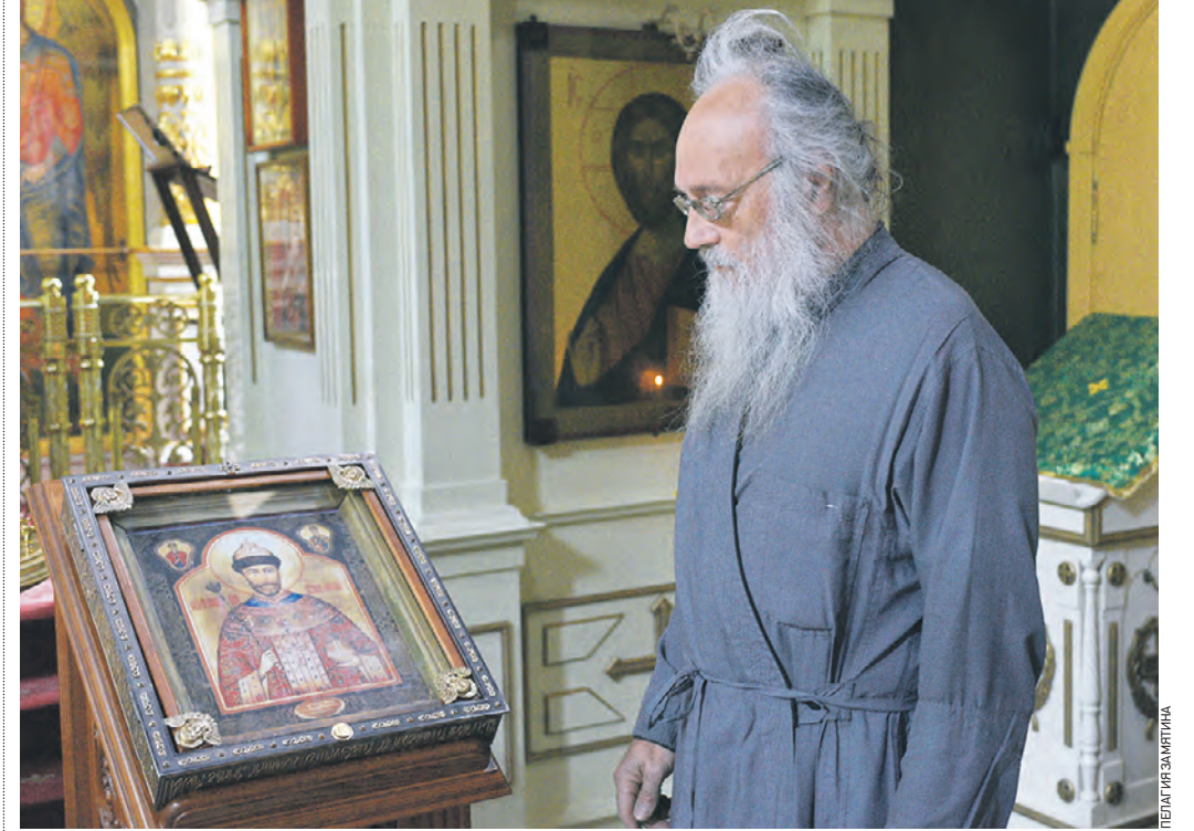
Вчера 15:15 Протоиерей Дмитрий Валоженич показывает мироточивую икону — образ царя-мученика Николая II

Чудотворный образ Николая II был написан в 1997 году. Императора изображали в велико княжеском одеянии, в шапке Мономаха, со скипетром и державой. А внизу образа надпись: «Сия святая икона написана в прославление Царя-мученика в России». Слева от Николая изображен праведный Иов Многострадальный, в день памяти которого и родился император.