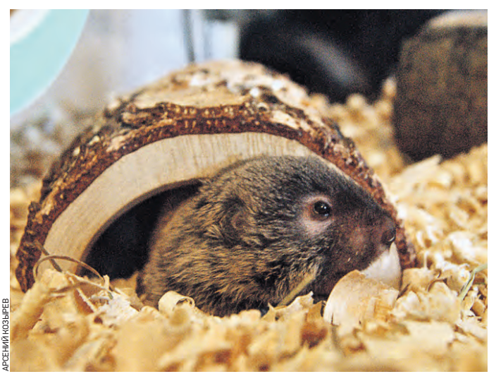
Вчера 13:46 Домашний слепышонка Тима отдыхает в своем небольшом домике

— Первое время, конечно, было тяжело найти с ними об-