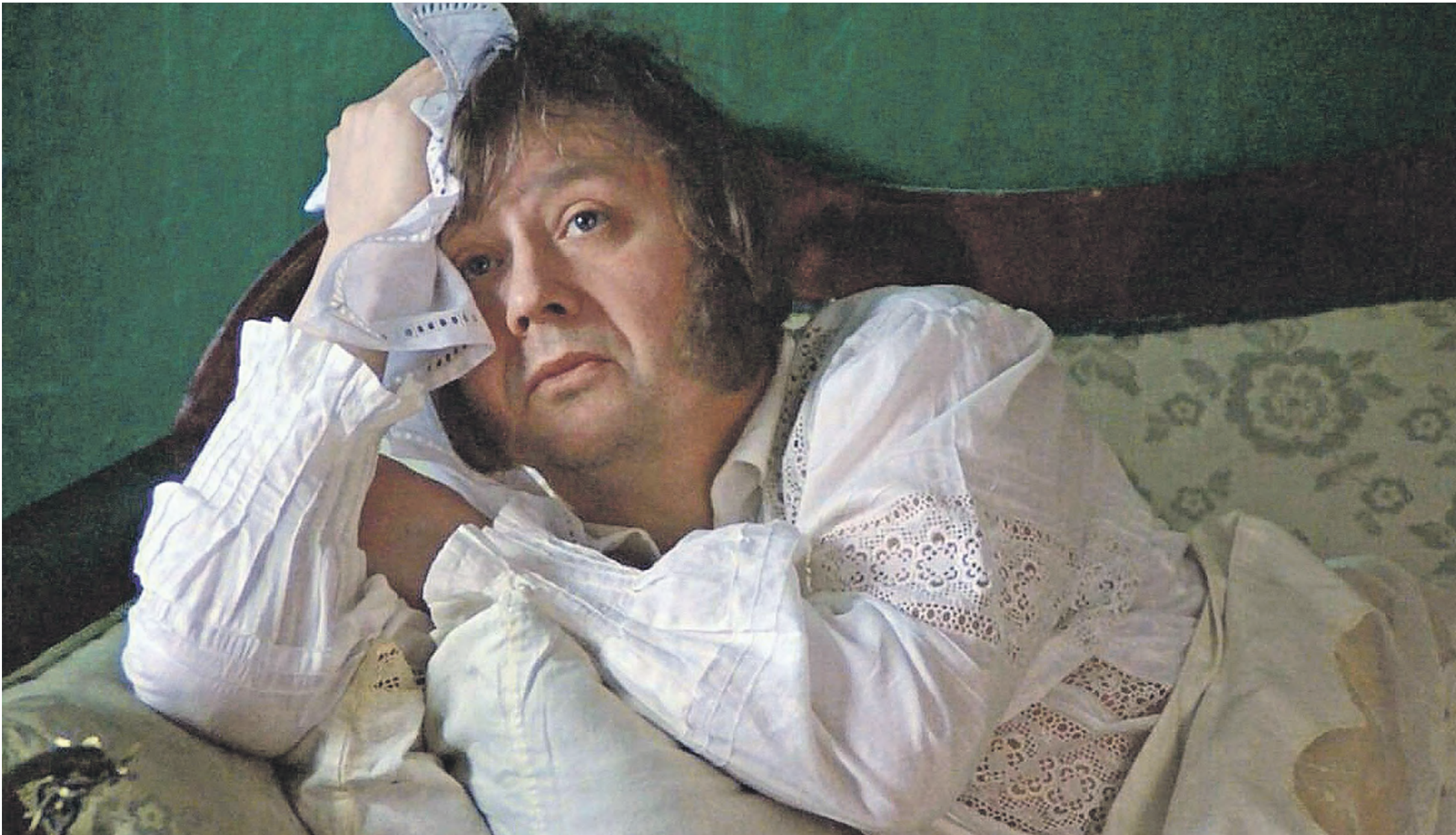
1979 год. Кадр из фильма «Несколько дней из жизни Обломова» Никиты Михалкова по роману Ивана Гончарова. Олег Табаков сыграл главного героя, который является символом апатичного, бездеятельного отношения к жизни

По мнению экспертов, мир слишком увлекся прогрессом и немного позабыл о человечности