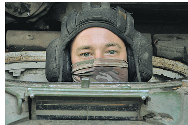
15 июля 2023 года. Член экипажа танка Т-90М «Прорыв» подразделений ЦВО ВС РФ во время несения службы на краснолиманском направлении в ЛНР

Экипаж танка Т-90М «Прорыв» Западного военного округа подавил огневые точки и опорные пункты Вооруженных сил Украины (ВСУ) на Кульском направлении. Об этом сообщили в Минобороны России. — Пока наша машина отработывала по врагу, заметили передвижение, присмотрелись, — отметил командир танковой роты. — Сначала пристально наблюдали, заметили, что это противник, отработали полный конвейер, после чего вызвали огонь ВСУ на себя и сразу оттуда откатились, отвлекли вражеские подразделения, чтобы они не работали по нашим боевым товарищам. У нас идет взаимодействие.