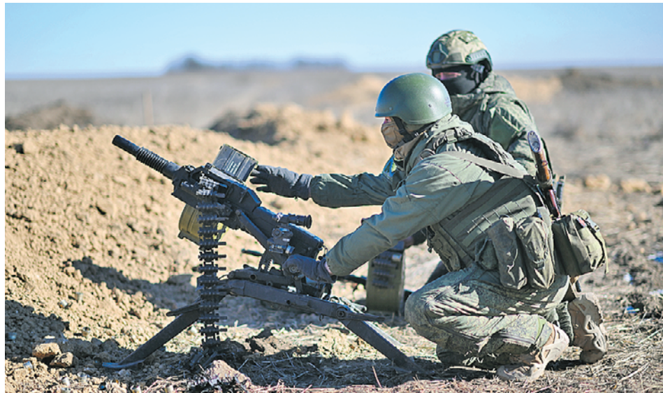
9 февраля 2023 года. Военнослужащие одного из мотострелковых подразделений ведут огонь из АГС по противнику на Южном направлении

Он добавил, что спецоперация на Украине показала уровень военно-технического развития разных стран. — В ходе СВО активно начали использоваться БПЛА, а артиллерия вновь показала себя «богом войны». Многие переживали, что при будущих противостояниях исход битв будут решать роботы или другая техника, но главным на поле боя остается мотострелок, — рассказал Андрей Кошкин. — Сегодня в армии России готовят для сухопутных войск настоящих