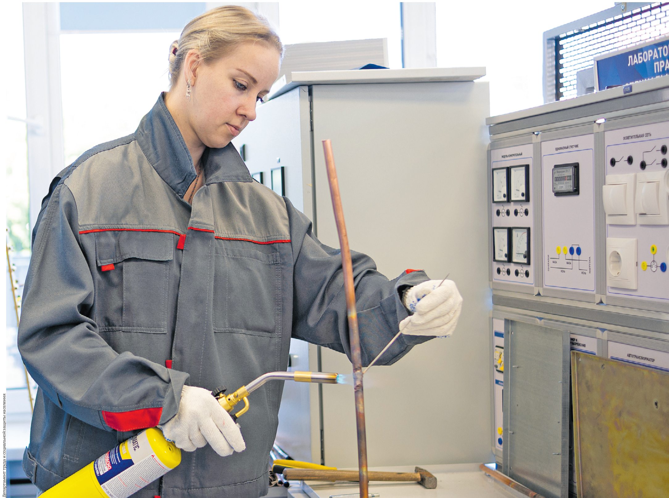
Департамент труда и социальной защиты населения