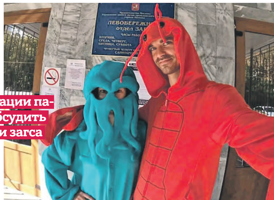
В Левобережном отделе ЗАГС Москвы пара расписалась в костюмах морских животных: невеста была осьминогом, а жених — креветкой

— Мы действуем по регламенту. Удивить, конечно, может необычный внешний вид или оригинальный подход: вместо обручальных колец пары иногда обмениваются какими-то предметами. Но все это заранее оговаривается с ведущей. Однако ничего сверхъестественного в московских загсах не происходит. Невесты, как в голливудских фильмах, не сбегают.