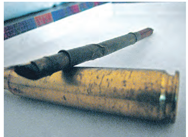
Ручка, которой пользовался командир Красной армии

— Продавец на барахолке даже подумать не мог, что за реликвию он мне передаст. Живо представляю себе, как ею красноармеец делал пометки на карте боевых действий или писал пись-