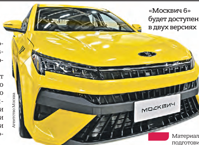
«Москвич 6» будет доступен в двух версиях

— Стоимость составит 2 626 000 рублей. Судя по комплектации, это просто отличная цена. Европейские аналоги, которые были ранее доступны, с такими комплектующими стоили дороже, — рассказал автоэксперт Руслан Хасянов.