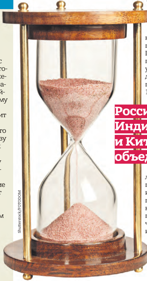
Насколько слова Ванги правдивы — покажет время