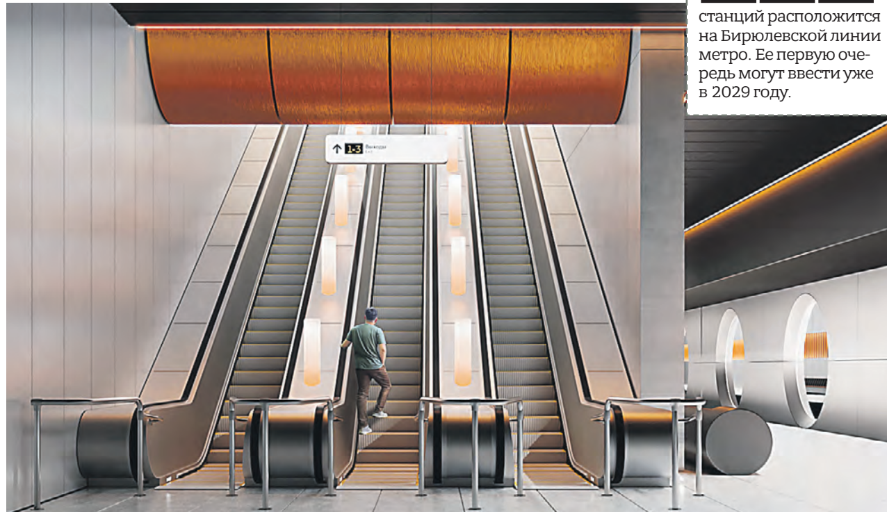
Проект станции «Лебедеянская» Бирюлевской линии Московского метрополитена, которую планируют начать вводить поэтапно уже к концу 2028 года

Дизайн нового объекта метро посвятят сырьевому богатству страны