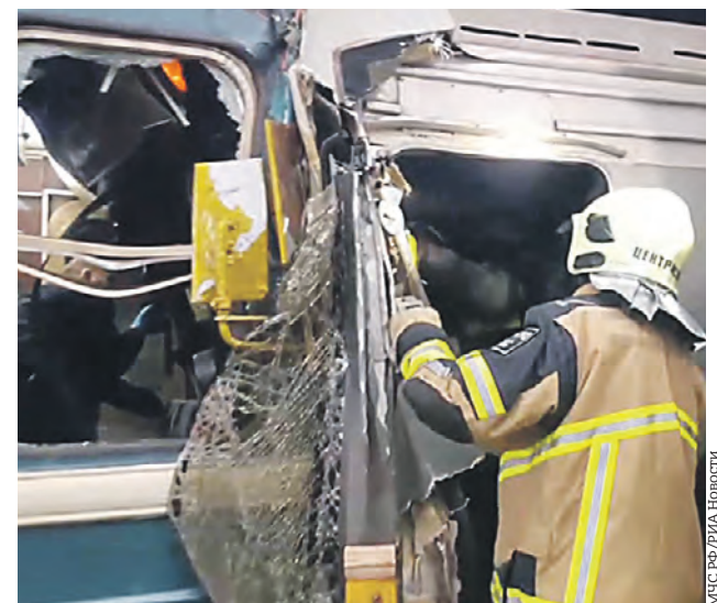
11 октября. Сотрудник противопожарной службы МЧС РФ проводит аварийно-спасательные работы