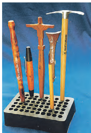
Небольшая коллекция пишущих ручек, привезенных из Бразилии

Еще одна поистине уникальная находка — винтажная ручка-карандаш, купленная на одной из столичных барахолок. Ею пользовался командир Красной армии — изделие нашли под Ржевом. Она представляет огромную ценность.