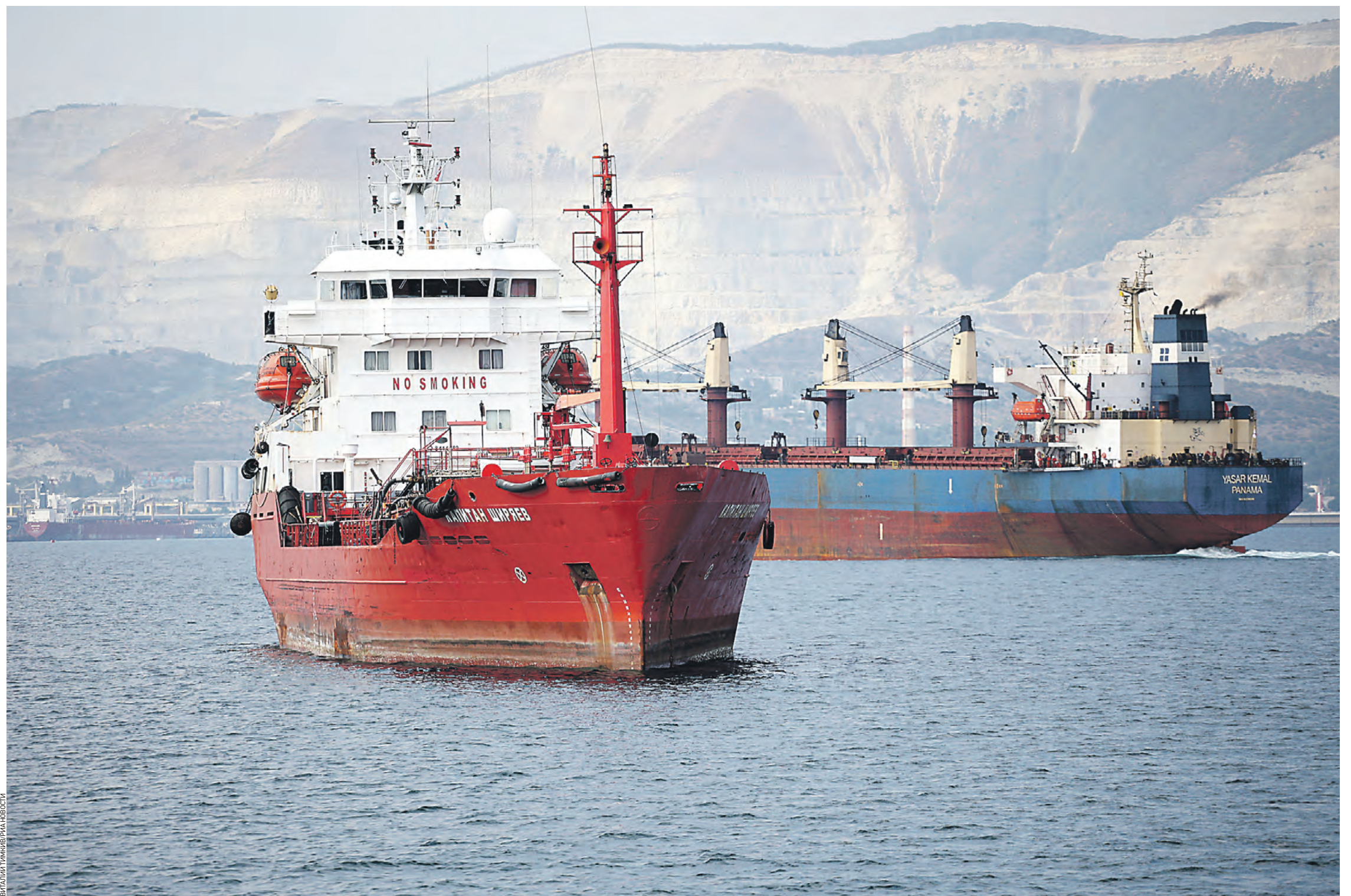
11 августа. Танкер «Капитан Ширьев» и сухогруз Yasar Kemal стоят на рейде в Цессемской бухте

Нефтегазовые доходы российского бюджета к сентябрю превысили показатели за аналогичный период прошлого года, когда санкции на нефть еще не вступили в силу, а мировые цены были гораздо выше. Правда, рост доходов исчислялся в рублях и отчасти объяснялся еще и значительной девальвацией российской национальной валюты по сравнению с прошлым годом. В том же сентябре, а также в октябре рубль упал до отметки 100 рублей за доллар и даже больше, что хуже показателей прошлого года примерно на 40 процентов. Хотя для российского бюджета это позволило выполнять все социальные обязательства, которые, как известно, тоже исполняются в рублях. В экономике нет знака равенства между девальвацией валюты и ростом инфляции, хотя опосредованная связь, безусловно, есть.