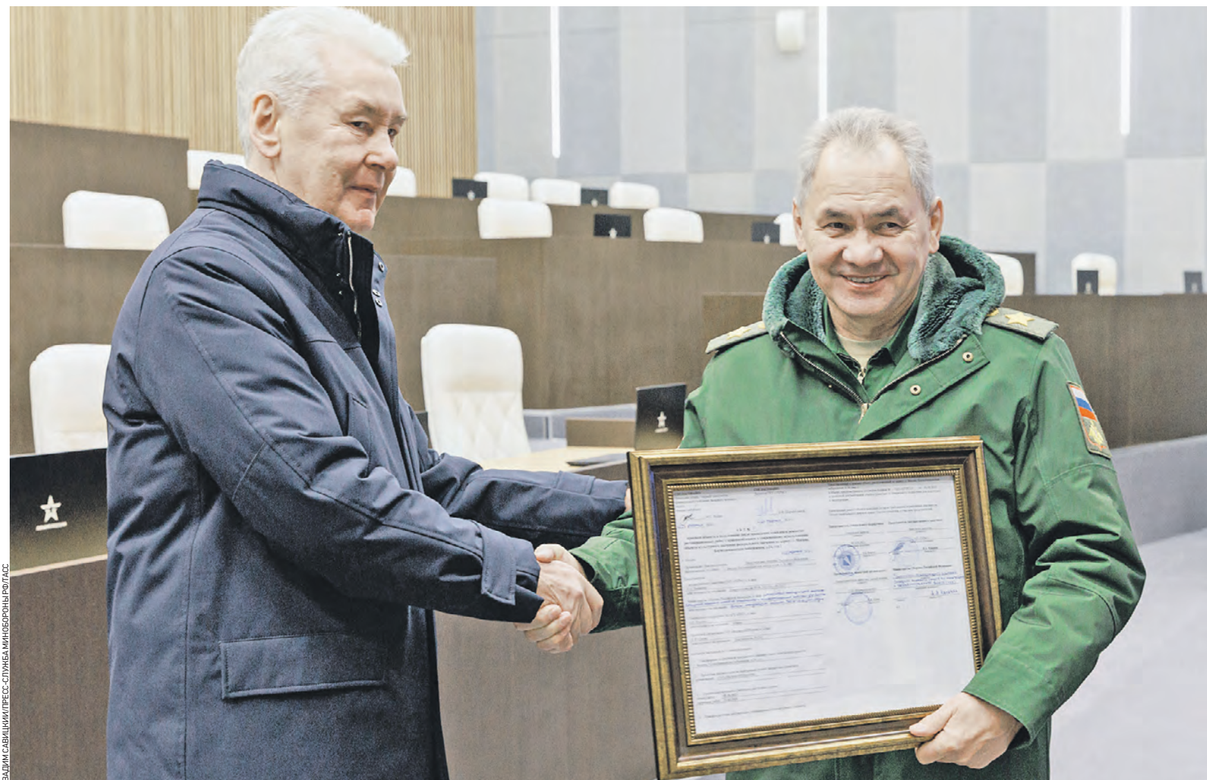
23 февраля. Мэр Москвы Сергей Собянин (слева) и министр обороны России Сергей Шойгу осмотрели историческое здание, в котором расположится штаб Московского военного округа. Глава города передал министру подписанные акты об окончании работ и передаче памятника архитектуры Минобороны РФ

Здание, в котором расположится штаб Московского военного округа, построили в 1780 году по проекту архитектора Николая Леграна для Кригскомиссариата — военного ведомства, отвечающего за снабжение всей русской армии. Оно было возведено в форме каре, открытого со стороны Садовнической улицы. Трехэтажный главный корпус украшал шестиколонный портик. Справа и слева к основному зданию примыкали двухэтажные крылья, замыкали композицию угловые башни с куполами и круглыми окнами. Фасады украшали изображения с различной воинской атрибутикой. В советское время со стороны Садовнической улицы появился еще