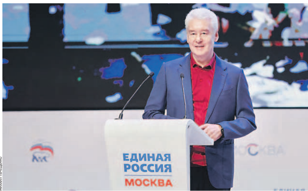
13 июня. Мэр Москвы Сергей Собянин принял участие в XXX Конференции Московского городского регионального отделения партии «Единая Россия»

сквичи будут оценивать всю нашу большую команду, как мы поработали последние пять лет. Мы должны понимать, куда двигаемся дальше и какие задачи ставим сейчас, — заявил Сергей Собянин. — За эти пять лет самым спокойным был 2019 год. Дальше не только Москву, но и всю страну накрыла серьезная ситуация с пандемией. Сегодня находимся в условиях проведения специальной военной операции. Таким образом, мы получили четыре года серьезных испытаний. Мэр столицы отметил: несмотря на то что с виду город внешне не изменился, живет нормальной жизнью, вокруг происходят процессы, меняющие политический ландшафт и общий уклад. — В таких условиях мы боремся за военную победу, политическую стабильность и экономический суверенитет, — продолжил глава города. Он подчеркнул, что Москва сегодня — оплот всей страны. Это касается и оборонной