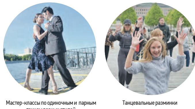
Мастер-классы по одиночным и парным танцам разных стилей

Обо всех мероприятиях можно узнать на сайте go.mos.ru