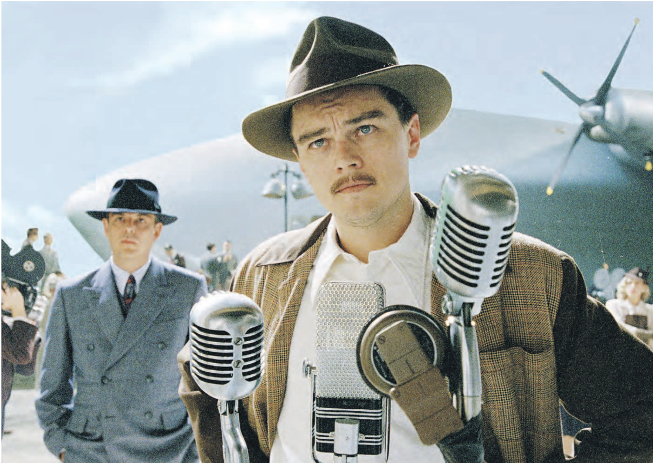
Герой картины «Авиатор» 2004 года Говард Хьюз (в исполнении Леонардо Ди Каприо) — эталонный достижатель. Он счастлив только в небе, где все решает его мастерство, но итогом всех его достижений становятся разочарования

Почему специалисты говорят, что достижатели ставят на кон свои жизни