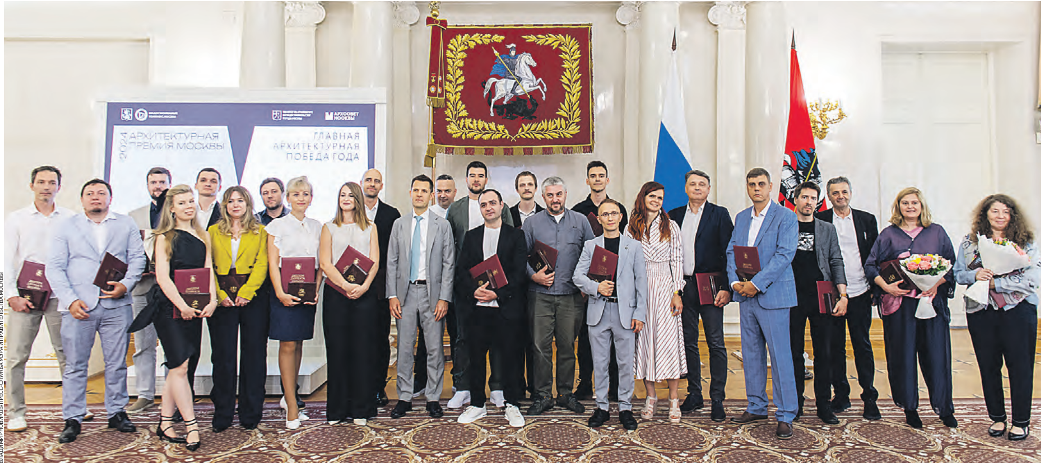
2 июля. Лауреаты премии Москвы в области архитектуры и градостроительства после церемонии награждения в Белом зале столичной мэрии. В этом году на конкурс подали 178 заявок, в финал вышло 48 проектов. Лауреатами премии стали 25 архитекторов — авторов 12 проектов в 11 номинациях