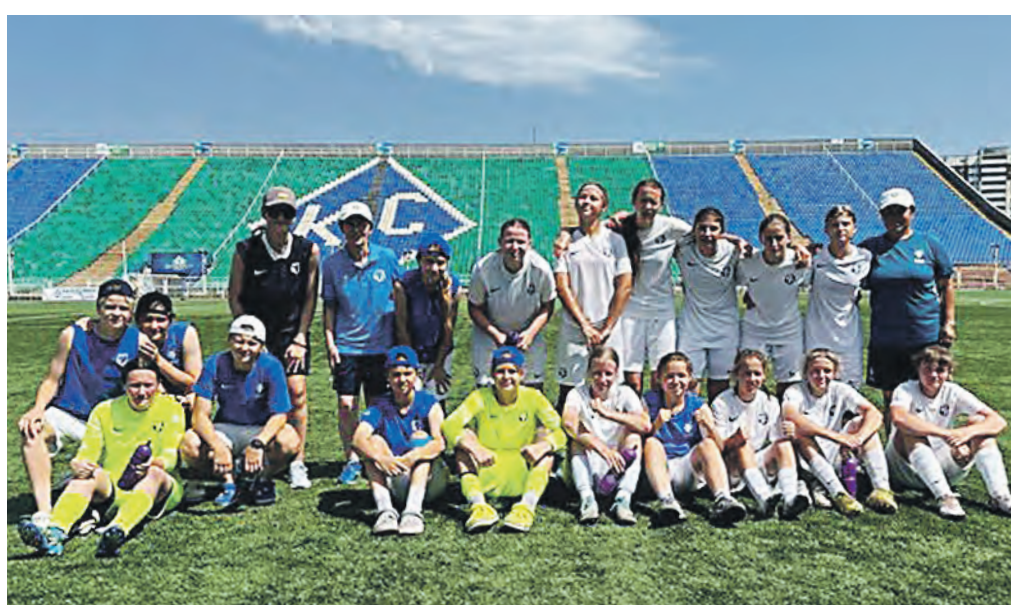
17 июня. Команда девушек «Чертаново» 2009/2010 годов рождения после матча в Самаре

Команда девушек «Чертаново» 2009/2010 выиграла у команд «Уфа» и «Крылья Советов» на чемпионате России в Самаре.