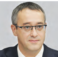
АЛЕКСЕЙ ШАПОШНИКОВ ПРЕДСЕДАТЕЛЬ МОСГОРДУМЫ

За без малого 10 лет в рамках программы проведено свыше 250 экскурсий, поездок, встреч, съемок в кинофильмах, открытий памятников, патриотических акций и многих других мероприятий. Ключевые мероприятия программы были реализованы именно в период деятельности VII созыва. В частности, были установлены и открыты памятники 6-й, 18-й, 21-й дивизиям Московского народного ополчения, четвертым дивизиям ополчения «второй волны» формирования, а также памятник «Плечом к плечу» 13-й Ростокинской дивизии народного ополчения. В результате этой работы в Москве теперь существуют памятники всем дивизиям Московского народного ополчения. Огромное спасибо всем участникам программы, особенно потомкам ополченцев, которые все это время хранили и хранят память о своих предках-героях. Сегодня московские добровольцы воюют на полях сражений специальной военной операции, повторяя подвиг своих дедов. Мы никогда не забудем подвиг московских ополченцев.