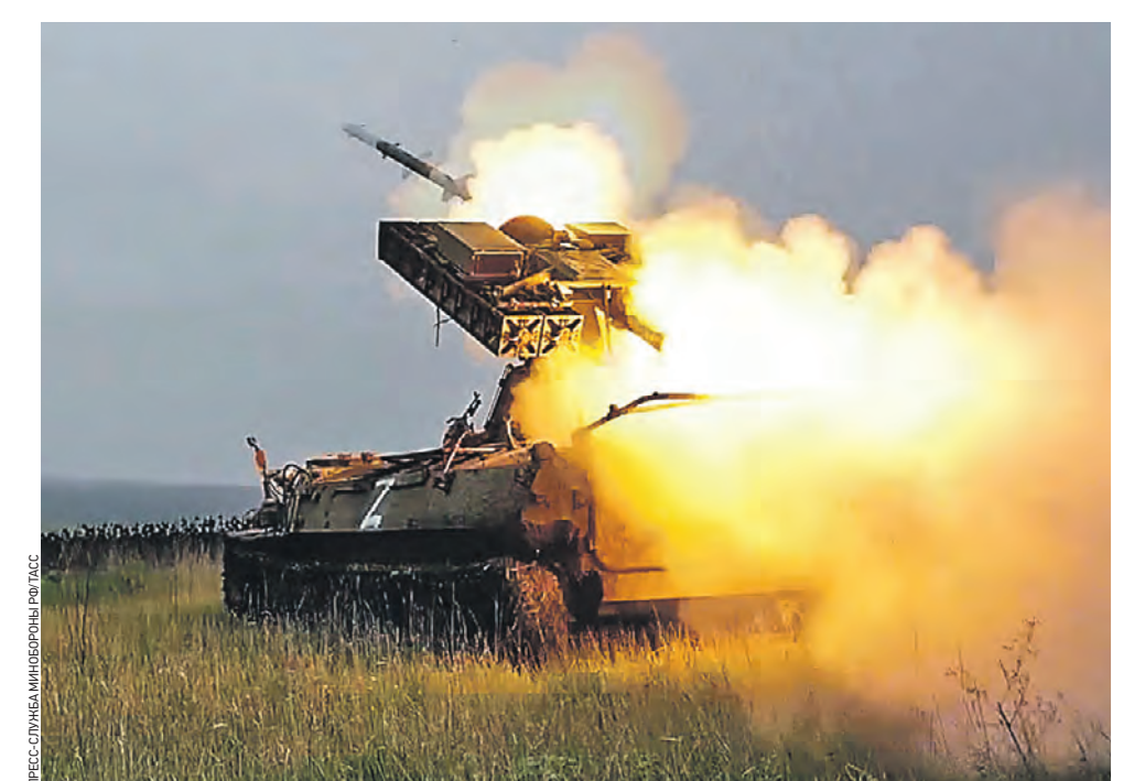
2 июля. Боевая работа расчета зенитно-ракетного комплекса (ЗРК) «Стрела-10» группировки войск «Север» в зоне спецоперации. В Министерстве обороны РФ сообщили, что бойцы регулярно «сканируют» небо, обеспечивая надежный щит от атак воздушных объектов ВСУ. Кроме того, ЗРК специализируется на прикрытии подразделений наших сухопутных войск, а также военных и гражданских малоразмерных объектов от атак.