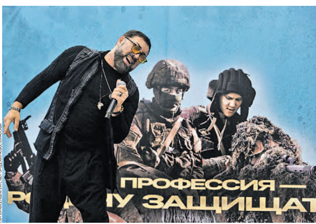
14 ноября. Певец Ян Марти выступает для бойцов, заключивших контракт в Единном пункте отбора. Своим творчеством он поддерживает военнослужащих с первых дней спецоперации