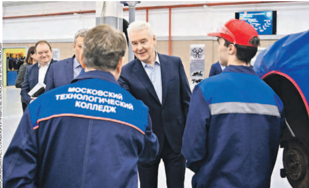
25 января. Мэр столицы Сергей Собянин (в центре) во время посещения Московского технологического колледжа общается со студентами и преподавателями

— На заключительном этапе встретились 600 ребят из разных регионов России. Испытания проходили по 12 направлениям, среди которых патриотическое, творческое, медиа, спортивное и предпринимательское, — рассказал мэр. Эксперты оценивали лидерские качества участников, креативное мышление, организаторские способности и умение находить нестандартные решения. Сергей Собянин добавил, что победители, наставники и колледжи получили денежные призы. Продолжая тему образования, мэр сообщил, что в ТиНАО