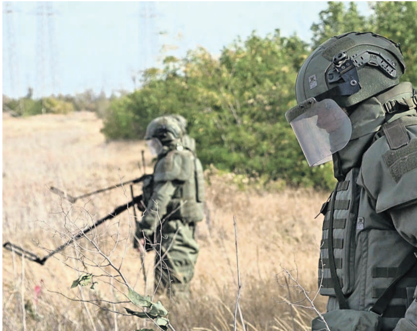
12 ноября. Российские саперы «Лорион» (на переднем плане), «Седьмой» (в центре) и «Скиф» ищут мины у подножия лесополосы на освобожденной территории.

— Иногда выезжаем по заявке от мирных жителей, у которых на участке остались неразорвавшиеся снаряды или мины, — говорит «Лорион». — Есть и работа «боксами»: выделяем определенный квадрат