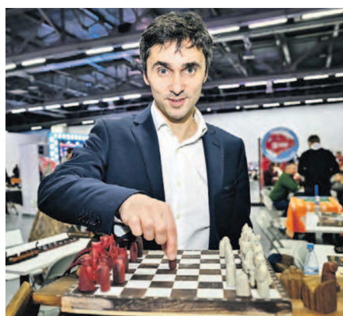
16 ноября. Президент Московской федерации го Тимур Санжин играет в шахматы.

Вчера на ВДНХ завершилась Первая московская Интеллектуальная олимпиада — праздник интеллектуального спорта и умного досуга для всей семьи. «ВМ» узнала подробности.