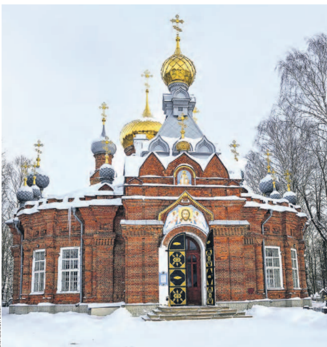
Церковь Спаса Нерукотворного образа в Бежецке. В 2007 году здесь был установлен поминальный крест, в основании которого увековечены имена более чем пятидесяти православных пастырей. Фото 2024 года

Неподалеку от него, на все той же улице Большой, установлена уникальная скульптурная композиция всей великой творческой семье: Николаю Гумилеву, Анне Ахматовой и их сыну историку Льву Гумилеву. В нескольких километрах от Бежецка, в селе Градница, в старинном бревенчатом доме, перевезенном из дворянской