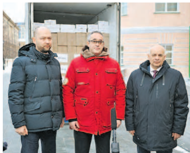
Пресс-центр Московской городской думы