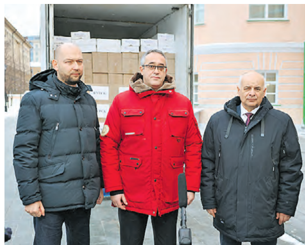
Пресс-центр Московской городской думы