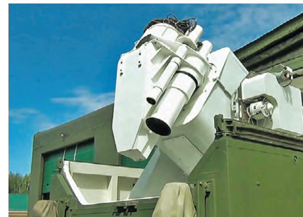
2018 год. Боевой лазерный комплекс «Пересвет» — предшественник «Задиры»

В ходе проведения спецоперации на Украине российские военные используют боевые лазерные комплексы нового поколения «Задира». Эти системы могут абсолютно свободно сбивать беспилотные летательные аппараты различного класса на дальности до пяти километров, что улучшает наши позиции на фронте.