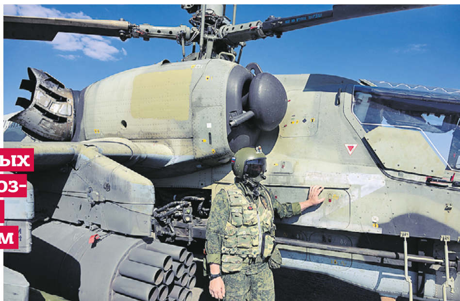
6 августа. Пилот разведывательно-ударного вертолета Ка-52 в зоне проведения спецоперации

Интересно, что разведывательно-ударный вертолет Ка-52М может нести несколько типов управляемо-