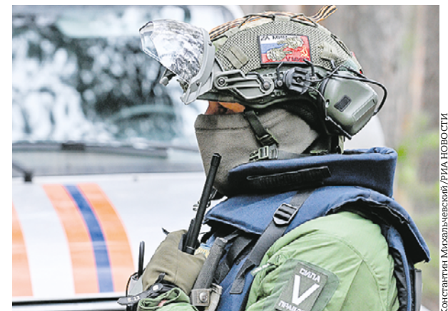
20 ноября 2014 года. Боец сводного отряда разминирования МЧС России в Курской области

Депутаты Госдумы намерены оперативно рассмотреть законопроект, приравнивающий российских военнослужащих Курскую область от украинских националистов, к участникам спецоперации. Таким образом на них будут распространены все льготы и выплаты, причитающиеся бойцам СВО.