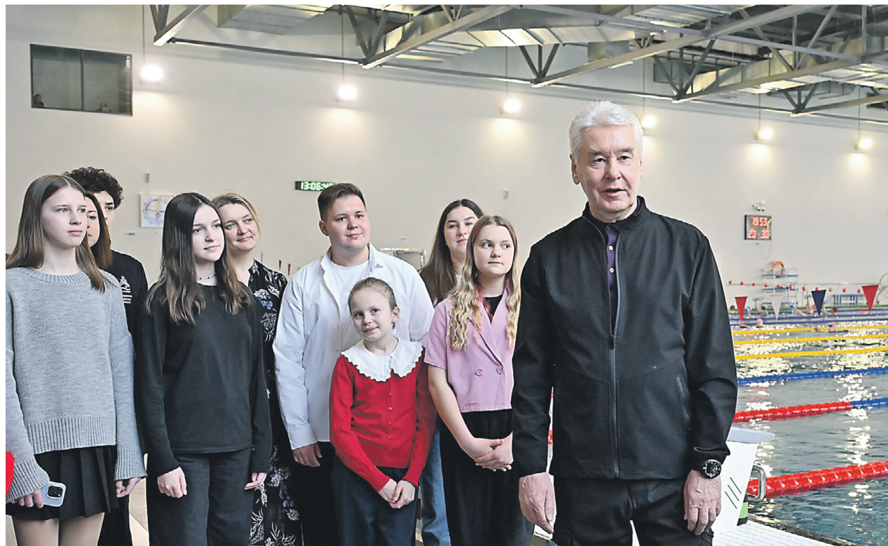
10 марта. Мэр Москвы Сергей Собянин (справа) пообщался с жителями Алексеевского района. Они следили за строительством спортивного комплекса «Стальной» и с нетерпением ждали его открытия. Вместе с мэром горожане осмотрели уникальный 50-метровый бассейн. Его чаша выполнена из нержавеющей стали