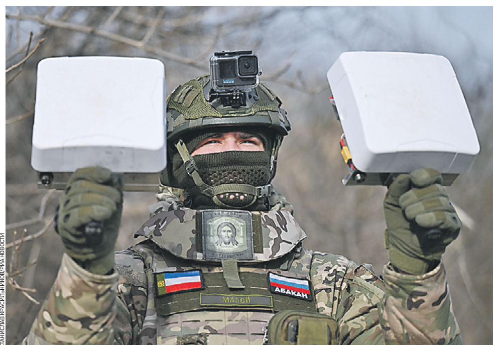
8 марта. Боец подразделения радиоэлектронной борьбы группировки «Север» на курском направлении специальной военной операции. Ежедневно военнослужащие подразделения РЭБ дают отпор беспилотным летательным аппаратам противника, предотвращая возможные вражеские атаки в зоне спецоперации. Справляться с этой задачей бойцам помогают не только современные технологии, но и профессиональные навыки, мужество и смелость.