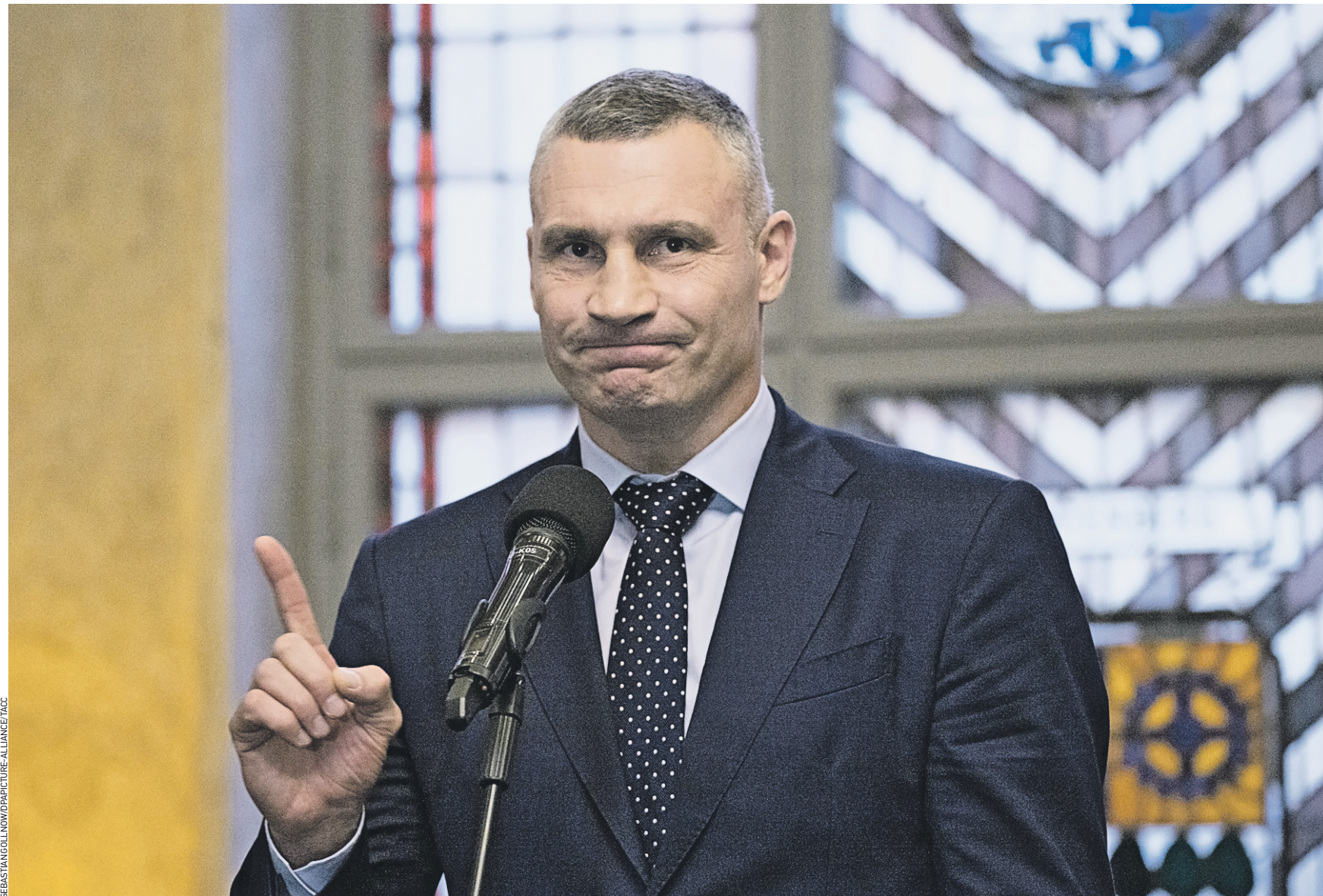
Мэр Киева Виталий Кличко, который занимает этот пост с 2014 года, может, конечно, рассматриваться как один из кандидатов на пост президента страны. Но политологи все же его фигуру как преемника Владимира Зеленского все же не рассматривают

Надо ли лишний раз напоминать, что уже не только Москва полагает, что Зеленский не имеет права подписывать от имени Украины международные договоры, но и в Вашингтоне откровенно намекают на необходимость президентских выборов. Позицию же новой американской технологической элиты четко сформулировал Илон Маск: «Зеленский проиграл с треском любые президентские выборы!» Сразу оговоримся, что в такой президентской гонке не будет сколько-нибудь приемлемого кандидата для России. Однако выборы позволили бы перезагрузить ситуацию на Украине, ослабить давление самых оголтелых украинских нациков и начать реали-