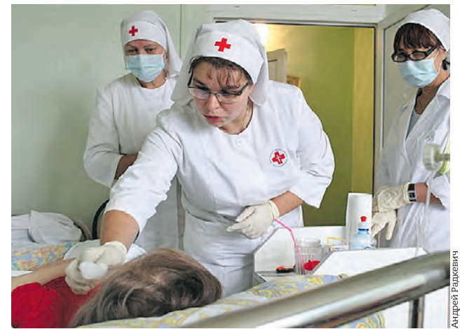
Школа станет площадкой для обучения всех тех, кто видит свое призвание в помощи другим

Участники курсов научатся оказывать помощь паллиативным больным, ознакомятся с вопросами боли и обезболивания, а также проблемами эмоционального выгорания у медработников и его профилактики. Пройти курс обучения могут все желающие бесплатно.