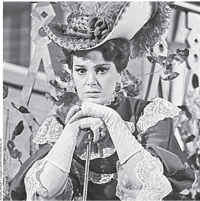
1 декабря 1964 года. Заслуженная артистка СССР Элина Быстрицкая в спектакле по пьесе Максима Горького «Дачники»

Из-за рвения помогать отцу семья ожидала, что дочь продолжит свой путь в медицине, но девушка устроила настоящий бунт, решив пойти в артистки — на всю жизнь она насмотрелась на страдание и боль. Сошлись, что дельная профессия, раз врачом быть не хочется, — педагог. Но едва став студенткой, Быстрицкая организовала танцевальный кружок и после побед на смотрах и конкурсах все же ушла в театральный. Единственное — актриса никогда не отказывалась играть врачей, даже если