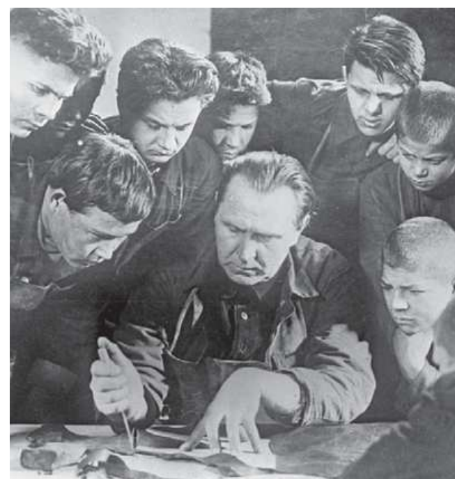
Кадр из художественного фильма «Путевка в жизнь» (1931). За эту работу режиссер Николай Энк получил приз первого международного кинофестиваля, прошедшего в Венеции