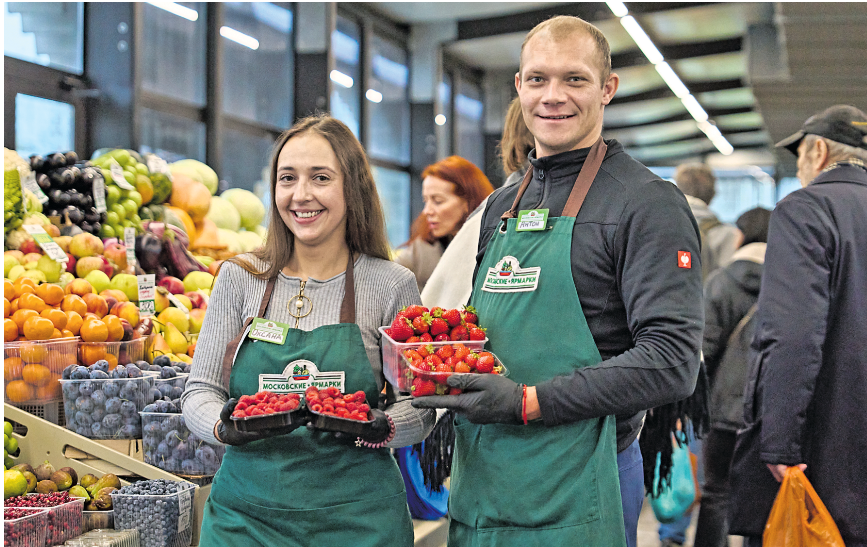
10 декабря 2025 года. Семья Кукушкиных из Липецкой области привозит на столичные ярмарки свой урожай. Супруги также активно помогают участникам СВО