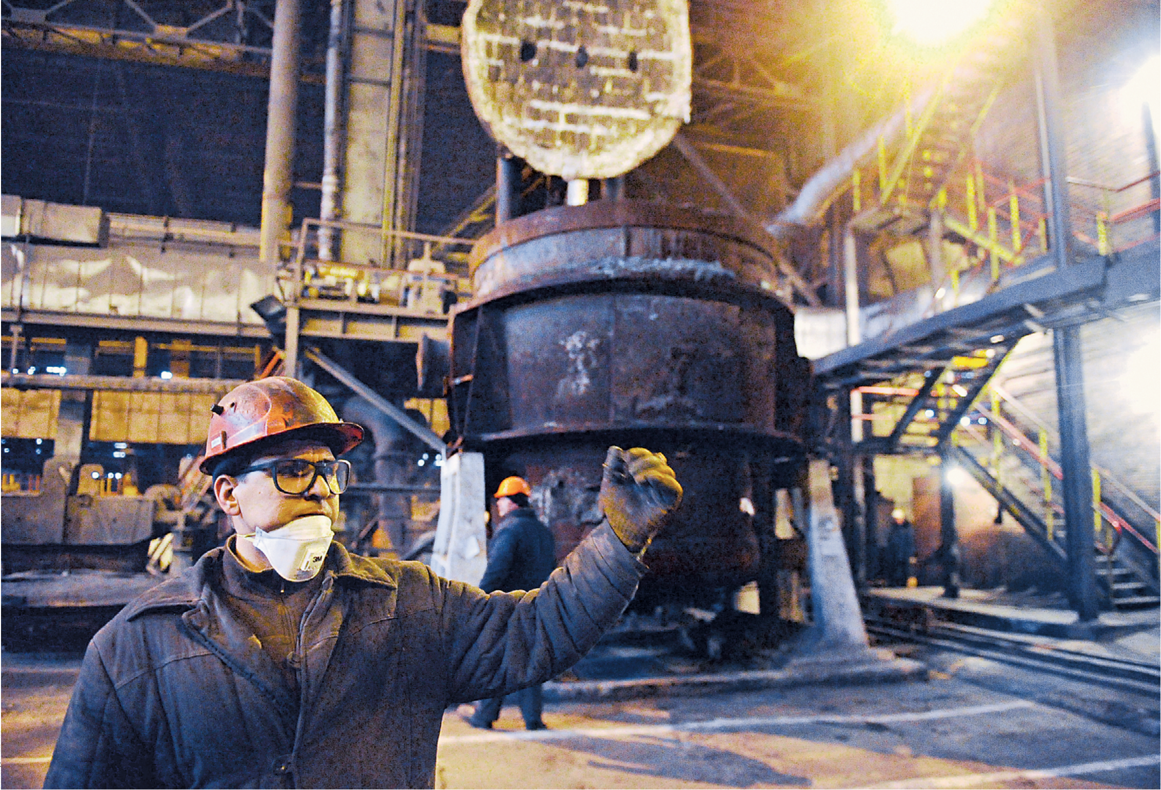
27 февраля 2017 года. Дончанин во время восстановительных работ в электросталеплавильном цехе Донецкого металлургического завода, который был поврежден в результате обстрелов со стороны ВСУ

Заслуженный эколог ДНР Роман Кишкань отмечает, что после 2014 года было много публикаций, обвиняющих республику якобы в развивающемся экологическом кризисе. — В основном из-за мокрой консервации шахт, которая происходила вследствие украинской агрессии, приводившей к обесточиванию шахт и остановке подземных водоотливных комплексов, — сказал Роман Кишкань. — Однако главные опасения заключались в брошенных украинским правительством заводах, местах размещения опасных отходов и прочих объектах накопленного вреда окружающей среде.