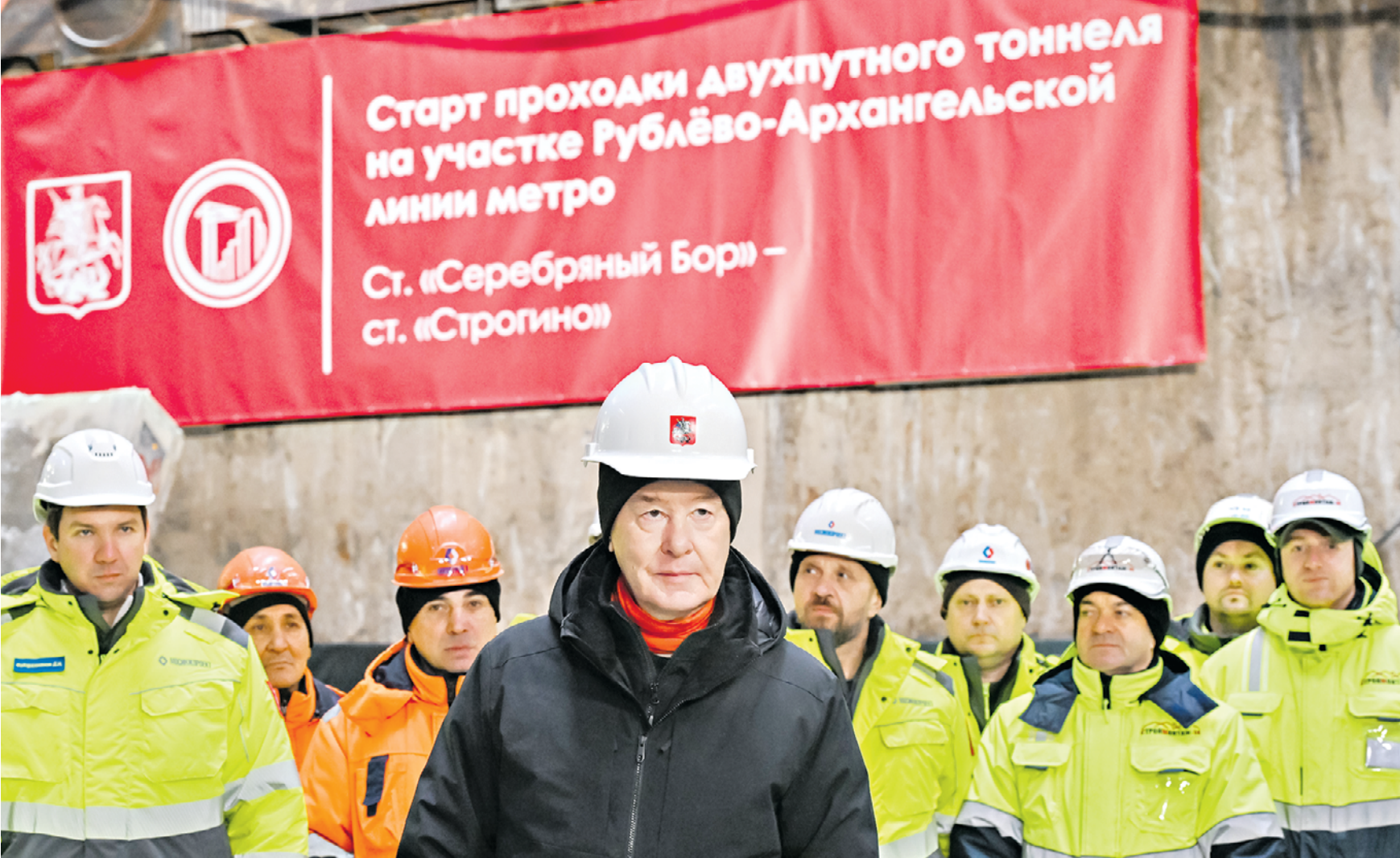
15 января. Мэр Москвы Сергей Собянин (на первом плане) дал старт началу проходки двухпутного тоннеля на участке от будущей станции «Серебряный Бор» до станции «Строгино» Рублево-Архангельской линии метро. Такая технология прокладки тоннелей значительно сокращает сроки строительства

За прошедшие полтора десятка лет в столице построили и реконструировали 127 станций метро и Московского центрального кольца. При их создании активно используются новые технологии и нестандартные архитектурные подходы. — Новые станции становятся архитектурными шедеврами, как этого и требуют традиции московского метро, — подчеркнул Сергей Собянин. Одним из ключевых технологических прорывов стала проходка двухпутных тоннелей одним щитом диаметром десять метров. Впервые ее применили на Некрасовской линии, а затем использовали при строительстве Большой кольцевой линии. Благодаря этой технологии удается сэкономить время и средства на возведении перегонов между станциями. — Сейчас аналогичным образом ведется строительство участка Рублево-Архангельской линии, а в перспективе такие решения появятся и на Бирюлевском радиусе, — заявил мэр Москвы.