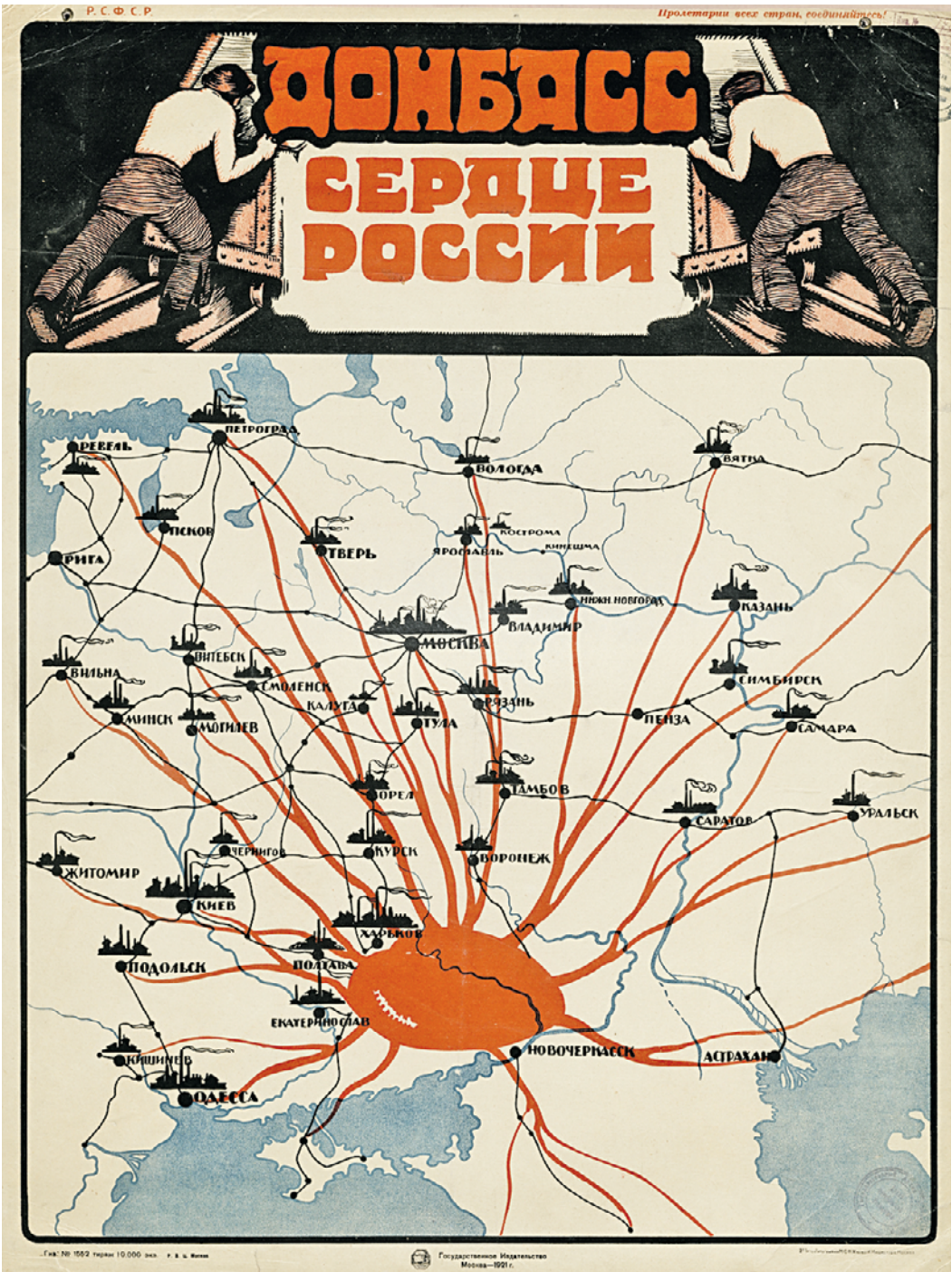
Советский агитационный плакат «Донбасс — сердце России» был создан в 1921 году неизвестным автором. Слоган однозначно давал понять — регион экономически важен для страны

уникальных промышленных «очагов». Тот же Лутугинский валковый комбинат или Константиновский стекольный завод, на котором был изобретен селеновый рубин для легендарных звезд Московского Кремля. В свое время в Донбассе побывал русский ученый Дмитрий Менделеев. Он ознакомился с геологией и экономикой бассейна. Успел побывать на многих шахтах, в том числе на Рутченковской, Лисичанской. Ученый утверждал, что в Донбассе можно найти почти все, что есть в периодической системе элементов, заметив: «Словом, недавняя пустыня ожила. Успех полный. Возможность доказана делом».