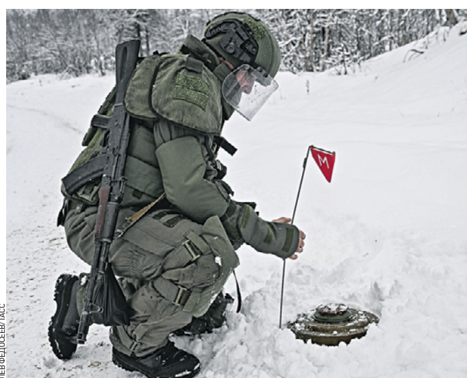
13 ноября 2025 года. Военнослужащий отдельного морского инженерного Северного полка устанавливает противотанковую мину ТМ-62М