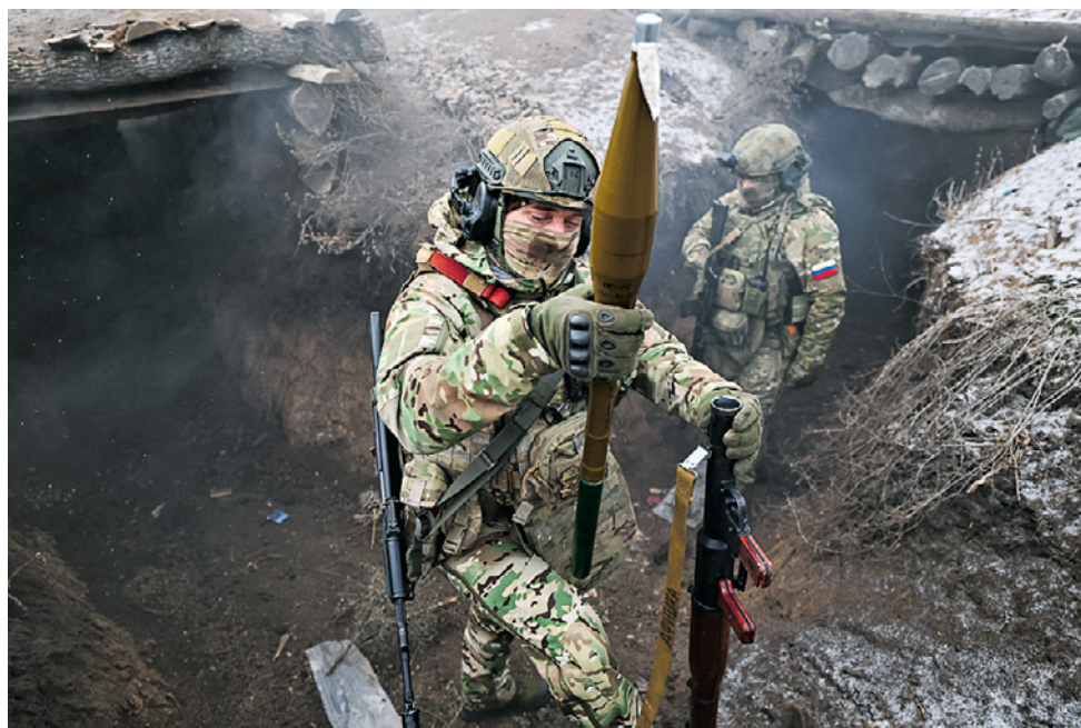
16 января. Военнослужащие добровольческого отряда «БАРС-31» Южной группировки войск готовятся к выполнению боевой задачи. Работу отряд ведет в ЛНР. За минувшие сутки бойцам группировки удалось улучшить тактическое положение. Они нанесли поражение бригадам противника в районе нескольких населенных пунктов в ДНР. В результате их действий враг потерял до 225 военнослужащих.