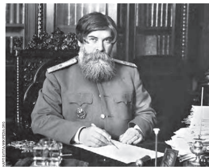
Российский военный врач, академик Владимир Михайлович Бехтерев. 1910-е годы