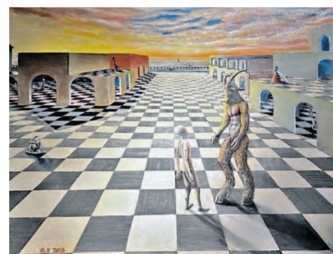
Декабрь 2025 года. Картина экспозиции «Многовоковая игра на душу» Оле Идриса.

Согласитесь, что каждый из нас хоть когда-нибудь мечтал поспать в музее. И такая возможность представилась в Центре современного искусства «Марс» на инновационной мультисенсорной выставке «Сон в музее». Экспозиция получилась очень необычной. Каждая из картин погружает посетителя в мир сновидений художницы Оле Идриса. А попласть в другое измерение гостям выставки помогают особое звуковое сопровождение, всевозможные иммерсивные технологии, голограммы и мини-лекции о типах сна. Поэтому каждый может почувствовать себя в своем или даже чужом сне.