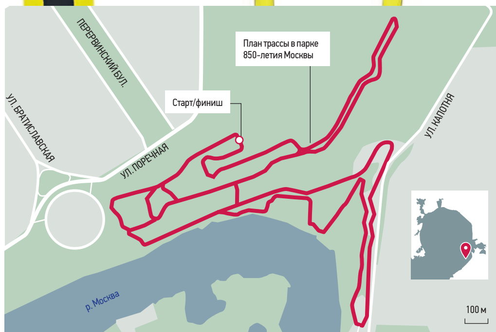
План трассы в парке 850-летия Москвы