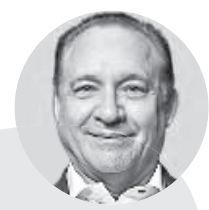
МАКСИМ ДУНАЕВСКИЙ КОМПОЗИТОР, СЫН ИСААКА ДУНАЕВСКОГО

Отец был очень самокритичным композитором, никогда не издавал и не исполнял то, что считал слабым. Ни деньги, ни награды не могли побудить его выдать миру нечто не соответствующее его уровню. Отец не просто обладал обаянием. Он был магнитом, центром притяжения любой компании. Женщины, мужчины — все влюблялись в него буквально с первого взгляда. Он спал не более пяти часов в сутки, но при этом умел «кусно жить». Знаю много людей, которым скучно отдыхать, скучно веселиться, — они думают только о работе. Но мой отец не из их числа. Он очень ценил жизнь со всеми ее радостями.