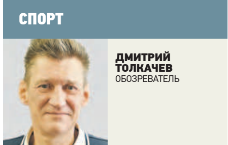
СПОРТ ДМИТРИЙ ТОЛЧАКОВ ОБОЗРЕВАТЕЛЬ