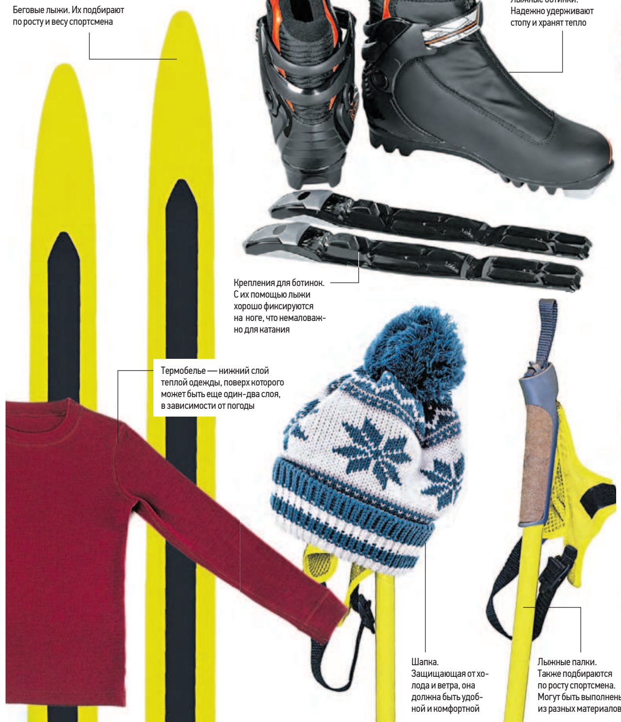
Беговые лыжи. Их подбирают по росту и весу спортсмена