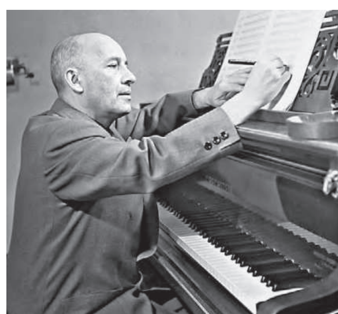
1 января 1950 года. Знаменитый советский композитор Исаак Дунаевский за созданием очередного музыкального шедевра

Отец был очень самокритичным композитором, никогда не издавал и не исполнял то, что считал слабым. Ни деньги, ни награды не могли побудить его выдать миру нечто не соответствующее его уровню. Отец не просто обладал обаянием. Он был магнитом, центром притяжения любой компании. Женщины, мужчины — все влюблялись в него буквально с первого взгляда. Он спал не более пяти часов в сутки, но при этом умел «кусно жить». Знаю много людей, которым скучно отдыхать, скучно веселиться, — они думают только о работе. Но мой отец не из их числа. Он очень ценил жизнь со всеми ее радостями.