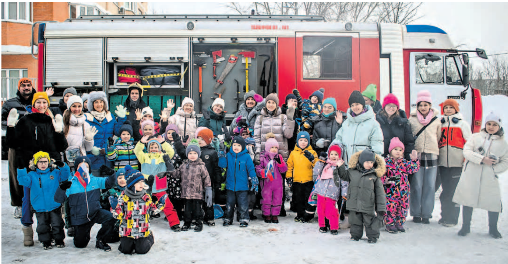
16 января. Участники конкурса «Пожарный снеговик» побывали на экскурсии в пожарно-спасательной части № 106 Южного административного округа и сфотографировались на память возле настоящей боевой пожарной машины.

СОБЫТИЕ Снеговвики, которых дети и их родители вылепили на необычном конкурсе, стали настоящим наглядным пособием по изучению правил противопожарной безопасности.