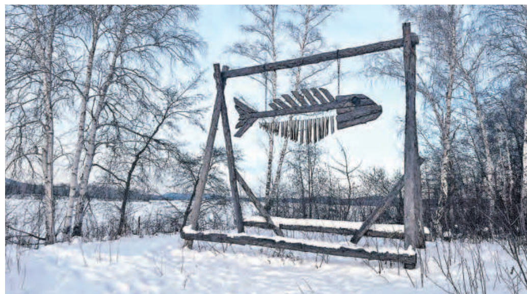
3 января. Кинетическая и звуковая скульптура «Ерш музыкальный» при помощи ветра может не только двигаться, но и «исполнять» уникальные «авторские песни».

гордо возвышающиеся над озером силуэты трех длиннейших динозавров, выполненных из металлической арматуры и ветвей. Здесь также можно встретить скульптуры медведя, занимающегося йогой, «ерша музыкального» и даже домик хоббита. Жили мы в гостевом домике. В отряде были как и взрослые, так и дети. Программа оказа-