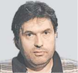
АЛЕКСАНДР ЛОСОТО ОБОЗРЕВАТЕЛЬ

Мнение колумнистов может не совпадать с точкой зрения редакции «Вечерней Москвы»