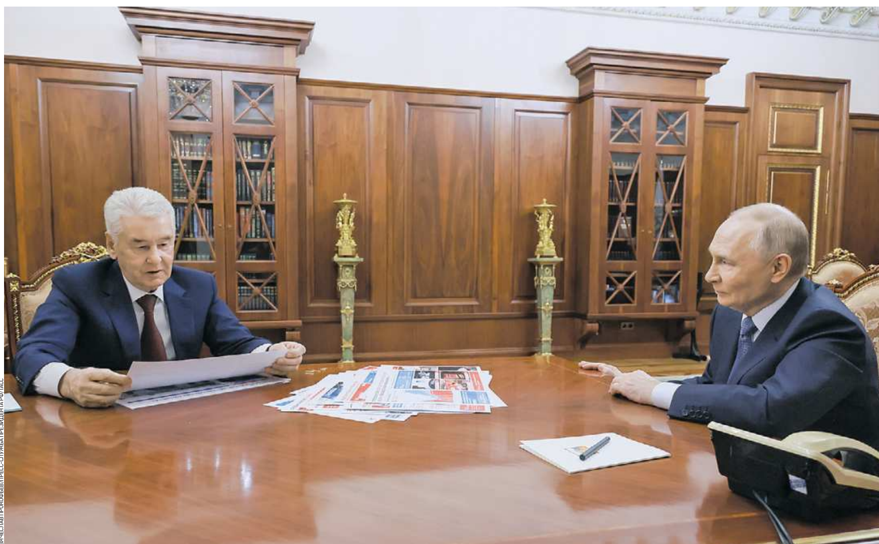
9 февраля. Мэр Москвы Сергей Собянин (слева) доложил президенту РФ Владимиру Путину о ключевых достижениях столицы и планах развития на ближайшие годы

Серьезных достижений удалось добиться в сфере здравоохранения. Так, в прошлом году завершилась модернизация амбулаторного звена. Москвичи получили 340 обновленных поликлиник. За 15 лет реконструировано и построено 170 корпусов больниц. — Обновлено уже больше половины медицинской инфраструктуры Москвы. Ни в одном городе мира за такой короткий срок не проводились такие масштабные программы по модернизации городской системы здравоохранения, — подчеркнул Сергей Собянин. В планах до 2030 года — завершить создание современного каркаса стационарной медицинской помощи. Также Москва — признанный российский лидер цифровизации медицины. В едином цифровом контуре уже работают