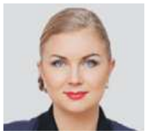
ИРИНА ВОЛЫНЕЦ ОБЩЕСТВЕННЫЙ ДЕЯТЕЛЬ, ОСНОВАТЕЛЬ НАЦИОНАЛЬНОГО РОДИТЕЛЬСКОГО КОМИТЕТА

Как молодой родитель, я полностью поддерживаю инициативу введения оплачиваемых дней для посещения школьных мероприятий, однако считаю предложенную норму лишь первым шагом. Для реальной поддержки семей необходимо расширить это право до четырех оплачиваемых выходных в месяц — по два дня на каждого родителя. Такая мера позволит полноценно участвовать в воспитании детей без ущерба для семейного бюджета и профессиональной деятельности. Уверенность в социальной защищенности и возможность соблюдать баланс между работой и домом станут мощным стимулом для роста демографии в стране. Только системная работа поможет создать условия, в которых семьи будут готовы к рождению детей.