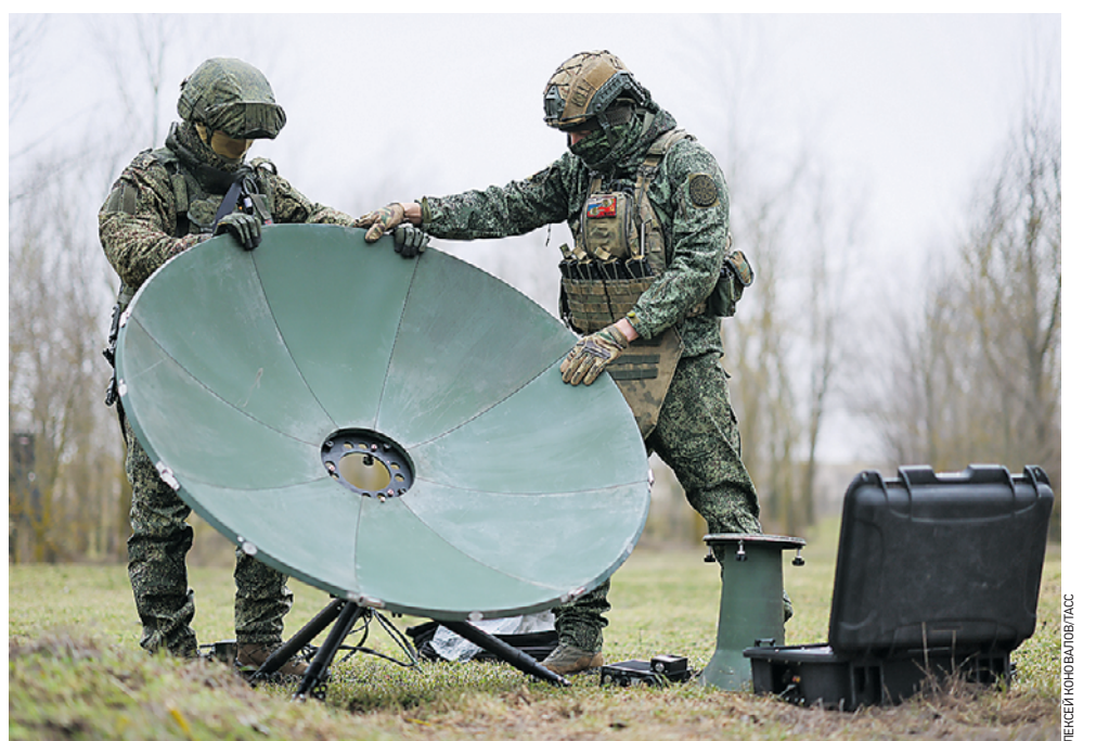
1 марта. Военнослужащие подразделения связи 126-й гвардейской бригады береговой обороны 18-й общевойсковой армии в составе группировки войск «Днепр» занимаются развертыванием комплекса спутниковой связи «СНАРК-100Р» в зоне СВО. Такой комплекс обеспечивает обмен тактической информацией между российскими военными. Он работает в диапазоне от 10,7 до 14,5 ГГц. С его помощью можно передавать данные, организовывать аудио- и видеоконференции.