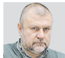
КИРИЛЛ КАБАНОВ ПРЕДСЕДАТЕЛЬ НАЦИОНАЛЬНОГО АНТИКОРРУПЦИОННОГО КОМИТЕТА РФ

тит бороду, надеть очки или капюшон — и вероятность идентификации падает процентов на 80. Поэтому, кстати, сейчас и прорабатывают законопроект о запрете нахождения в общественных местах в балаклавах и масках, чтобы облегчить задачу камерам.