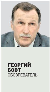
ГЕОРГИЙ БОБТ ОБОЗРЕВАТЕЛЬ