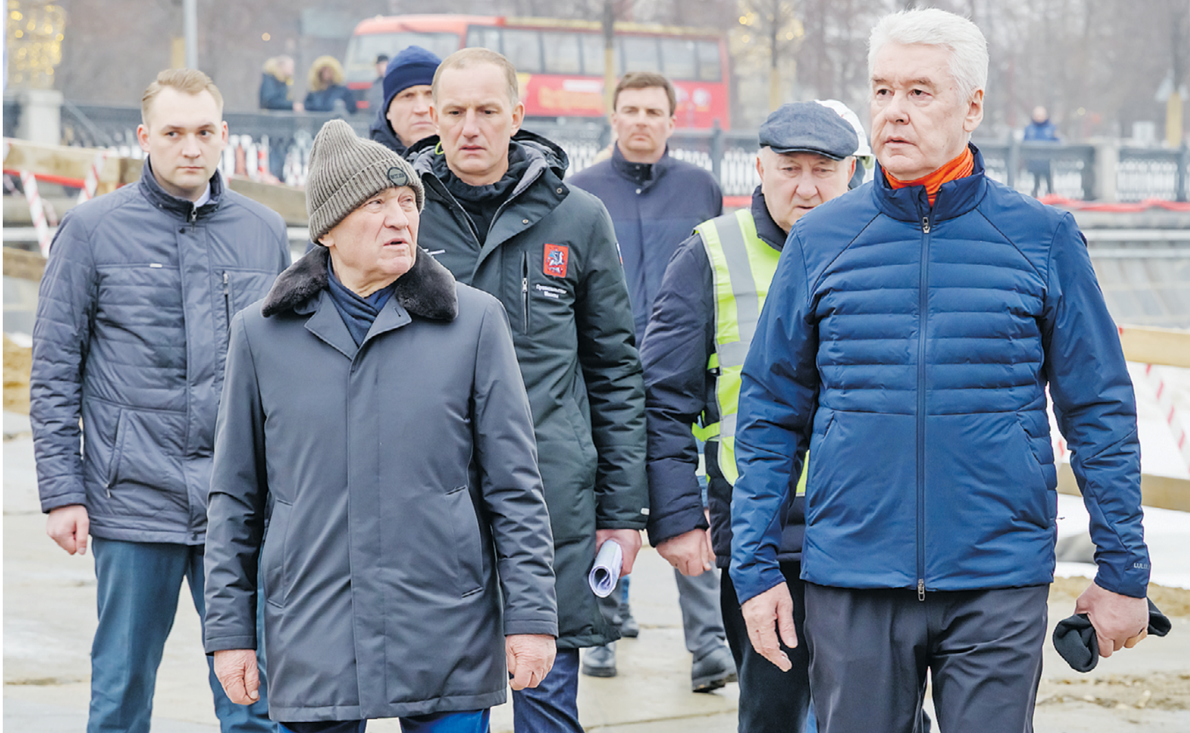
2 марта. Мэр Москвы Сергей Собянин и его заместитель по вопросам жилищно-коммунального хозяйства и благоустройства Петр Бирюков (справа налево на первом плане) осматривают ход строительства подмостового перехода на Болотной набережной.

Под Малым Каменным мостом появится новое пешеходное пространство. Мост длиной порядка 170 метров и шириной 5,4 метра, возводимый в русле Водоотводного канала, соединит участки Болотной набережной, разделенные улицей Серафимовича. — Приступили к активной фазе строительства пешеходного моста. Проект относительно небольшой, но в достаточной степени технологически сложный и важный для центра Москвы, — сказал Сергей Собянин. — По сути дела, создаем единое пешеходное пространство от Болотной до Дома культуры «ГЭС-2», «Ударника» и дальше — до Парка Горького и Воробьевых гор. По словам мэра, подмостовой пешеходный мост создаст комфортные возможности для передвижения без выхода на проезжую часть, сделает маршруты короче, удобнее и интереснее. — Думаю, этот пешеходный маршрут будет пользоваться большой популярностью как у москвичей, так и у гостей