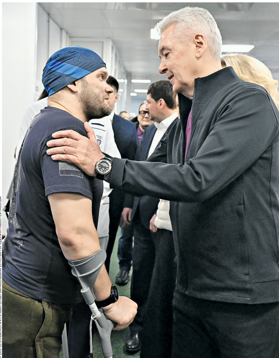
20 февраля 2025 года. Мэр Москвы Сергей Собянин (справа) во время посещения Центра протезирования и комплексной реабилитации для участников СВО

— В частности, в беззаявительном порядке выплатили ежегодную компенсацию на приобретение школьной формы — ее получили более 400 тысяч ребят из многодетных семей и детей с особенностями здоровья. Единовременную компенсационную выплату при рождении ребенка предоставили более чем 80 тысячам семей, статус многодетной семьи впервые — 13 тыся-