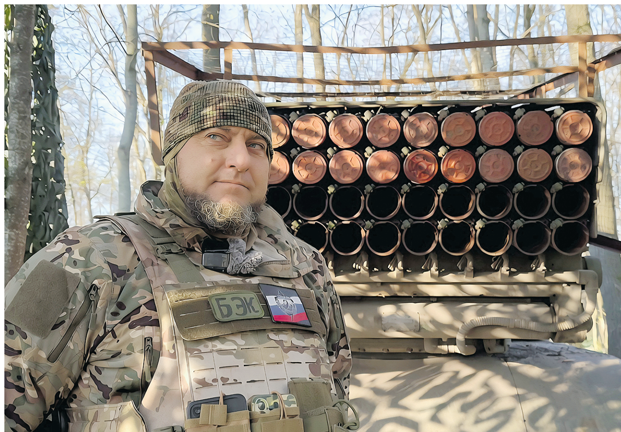
19 апреля. Заместитель командира взвода с позывным «Бэк» рядом со своей боевой машиной во время подготовки техники к очередному дежурству. РСЗО еще предстоит заправить и зарядить снаряды для стрельбы.

МОДЕРНИЗАЦИЯ ТЕХНИКИ ПОД ЗАПРОСЫ СВО ЗНАЧИТЕЛЬНО ПОВЫСИЛА ЖИВУЩЕСТЬ МАШИН