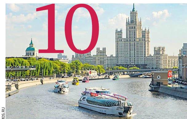
10 кораблей пройдут по Москве-реке во время парада судов, который состоится 24 апреля. Возглавит колонну электросудно регулярных речных маршрутов. Начало парада в 10:50 у Котельнической набережной.