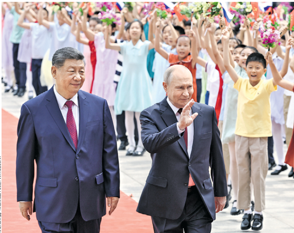
20 мая. Президент России Владимир Путин (справа) и председатель Китайской Народной Республики Си Цзиньпин в Пекине

Стороны приняли совместное заявление о дальнейшем укреплении партнерства и российско-китайских отношений. Оно подразумевает стратегическое взаимодействие и отношения,