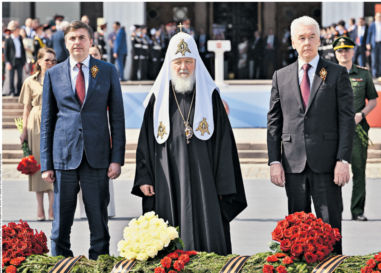
20 мая. Министр просвещения Российской Федерации Сергей Кравцов, Святейший Патриарх Московский и всея Руси Кирилл, мэр Москвы Сергей Собянин (на первом плане слева направо) возложили цветы к Вечному огню на Поклонной горе

По площади Победителей у Музея Победы прошли 52 парадных расчета: 41 расчет учащихся кадетских классов московских школ, воспитанники трех федеральных образовательных учреждений, кадеты из Московской, Волгоградской, Белгородской областей, Луганска и других регионов России. Также в параде приняли участие кадеты из Бреста. Ребятам приветствовали Святейший Патриарх Московский и всея Руси Кирилл, мэр Москвы Сергей Собянин и министр просвещения РФ Сергей Кравцов. — Кадеты хорошо знают историю России и мечтают вписать в нее свои имена. Вы умные, сильные, целеустремленные, вы успешны в учебе, в спорте и творчестве. Вы — патриоты нашей страны и упорно готовите себя к благому и важному делу — служению Отечеству и народу, — сказал Сергей Собянин, обращаясь к участникам парада. Он вручил благодарственное письмо школе № 1770