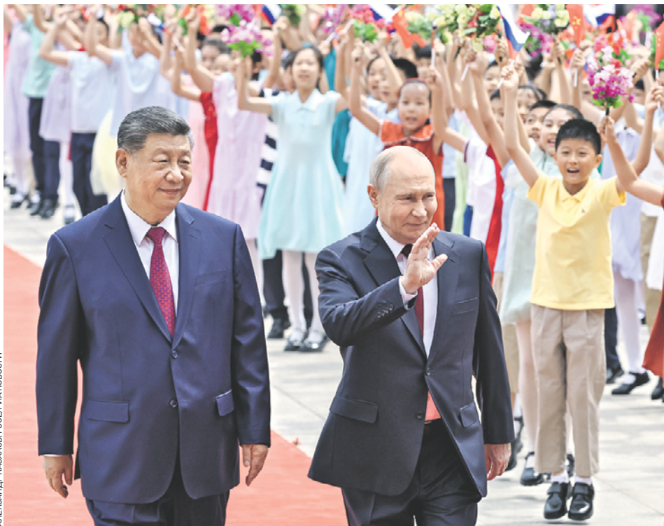
20 мая. Президент России Владимир Путин (справа) и председатель Китайской Народной Республики Си Цзиньпин в Пекине

Стороны приняли совместное заявление о дальнейшем укреплении партнерства и российско-китайских отношений. Оно подразумевает стратегическое взаимодействие и отношения,