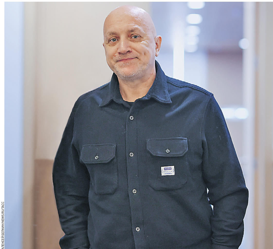
24 апреля. Писатель Захар Прилепин — писатель, публицист, общественный деятель. Лауреат премии Правительства Российской Федерации в области культуры и ряда других премий