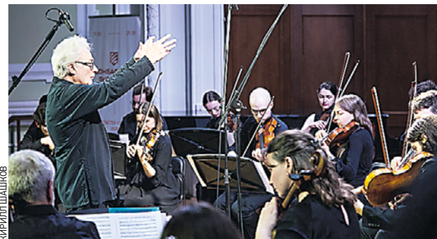
1 июля. Дирижер Леонид Лундстрем и оркестр камерной музыки Леонида Лундстрема выступают на сцене Малого зала Московской консерватории

На сцену Малого зала Московской консерватории вышли солисты Творческой мастерской Леонида Лундстрема — скрипач Петр Лундстрем, виолончелист Владимир Нор и оркестр камерной музыки под управлением Леонида Лундстрема. Для гостей вечера прозвучали произведения Антонио Вивальди, Петра Чайковского и Вольфганга Моцарта. Концерт собрал более 400 зрителей. — Я очень рад, что открытие прошло именно в Москве. В преддверии вы-